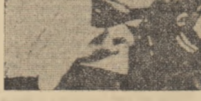
R.S.A. — Manifestația a studenților de la Stellenbosch împotriva discriminărilor rasiale practicate de regimul de la Pretoria

că „situația este dificilă și ne este mai degrabă agravată”, el a lansat un apel la „disciplină și muncă”, arătând că „sint necesare sacrificii pentru depășirea actualilor dificultăți”. Joi, cea mai mare parte a întreprinderilor din Fuenterrabia și-au întrerupt lucrul. La Irún, în întreprinderea unde lucra tânărul ucis de poliție, muncitorii s-au aflat, de asemenea, în grevă. Peste 600 de muncitori din Pasajes localitate situată în apropiere de Fuenterrabia, au organizat o manifestație de protest. Greve și demonstrații au mai avut loc în alte două localități, Renteria și San Sebastian.