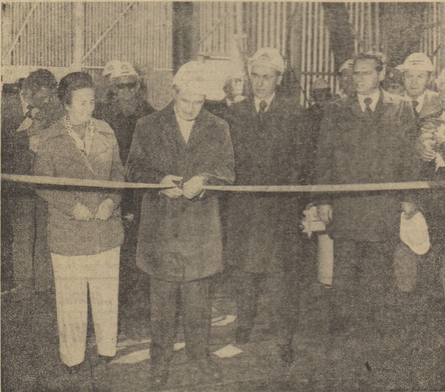
Moment de intensă emoție și mîndrie: inaugurarea instalației de foraj marin

plauze puternice, urale; se scandează: „Ceaușescu-P.C.R.”). Fără îndoială că la realizarea acestor recolte, un rol important au avut și organizațiile de partid din cooperativele agricole de producție, din întreprinderi, din S.M.A.-uri, organizațiile de partid a județului. De aceea, în felicitările adresate tuturor oamenilor muncii din agricultura județului am inclus și felicitări pentru organizația de partid din Ialomița, pentru toți comuniștii. Tutoarele adreșez urarea de a obține recolte tot mai mari în viitor! (Aplauze puternice, urale).