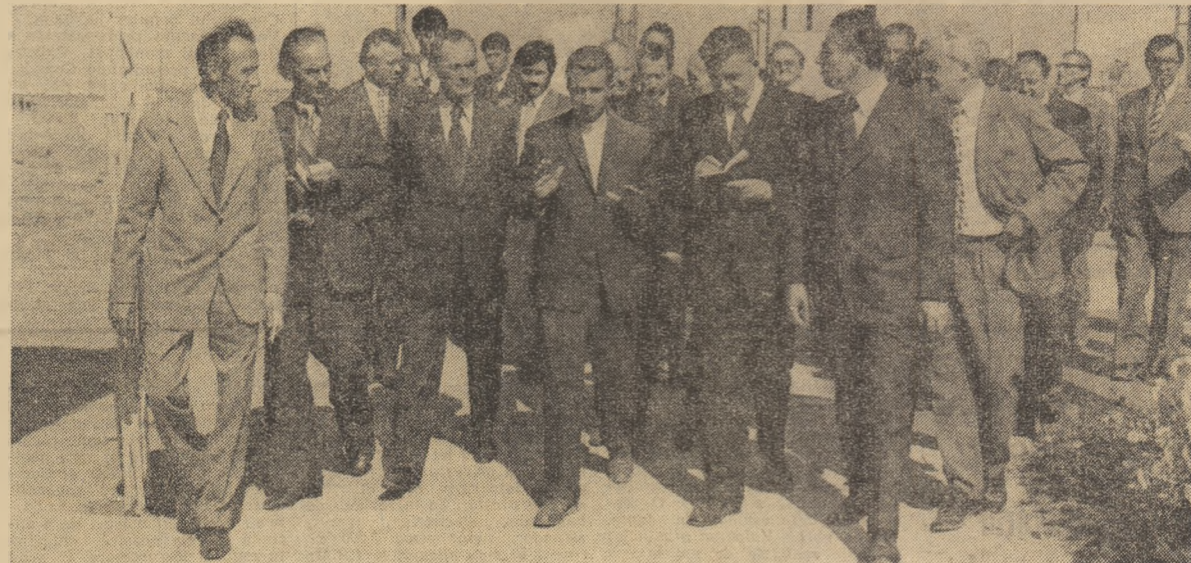
Rodnic dialog pe șantierul viitorului combinat siderurgic