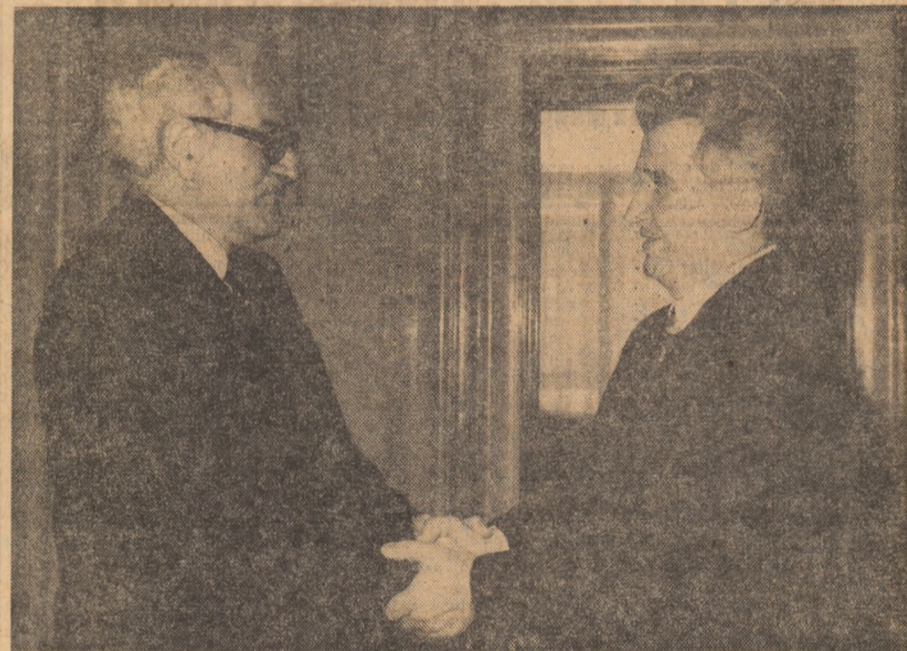
Tovarășul Nicolae Ceaușescu, secretar general al Partidului Comunist Român, s-a întâlnit marți cu tovarășul Pompeyo Marquez...

POMPEYO MARQUEZ, secretar general al Mișcării pentru Socialism (MAS) din Venezuela