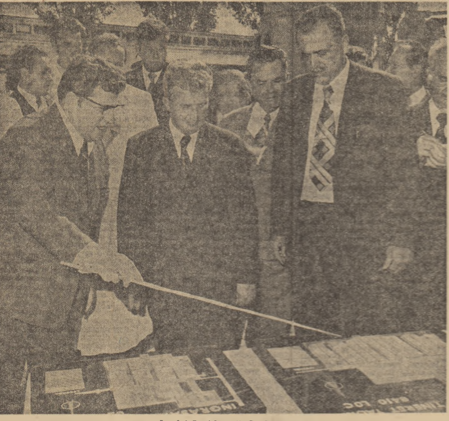
La I.A.S. Adunații Copăceni