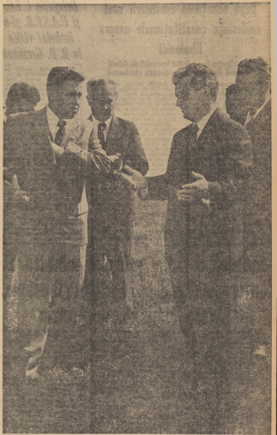
Pe școala întreprinderii agricole de stat Prundu

Abordându-se problema tehnologiilor de creștere a animalelor, au fost prezentate rezultatele și experiența dobândită până acum pe baza extinderii sistemului de stablație liberă în grajduri, relevându-se avantajele importante ale acestui procedeu care permite mecanizarea integrală a operațiilor de îngrijire a taurinelor. În acest cadru, secretarul general al partidului a apreciat unele soluții privind realizarea de ferme complexe cu platforme de muls, recomandând totodată utilizarea cu mai multă eficiență a investițiilor în acest sector, prin mai bună folosire a spațiilor. Pe parcursul vizitei, una din fermele I.A.S. Adunații Copăceni, tovarășul Nicolae Ceaușescu a rețut această problemă, cerind extinderea procesului vitacamelar în așa fel încât terenurile să fie folosite cu maximum de randament, cu mai mult spirit gospodăresc.