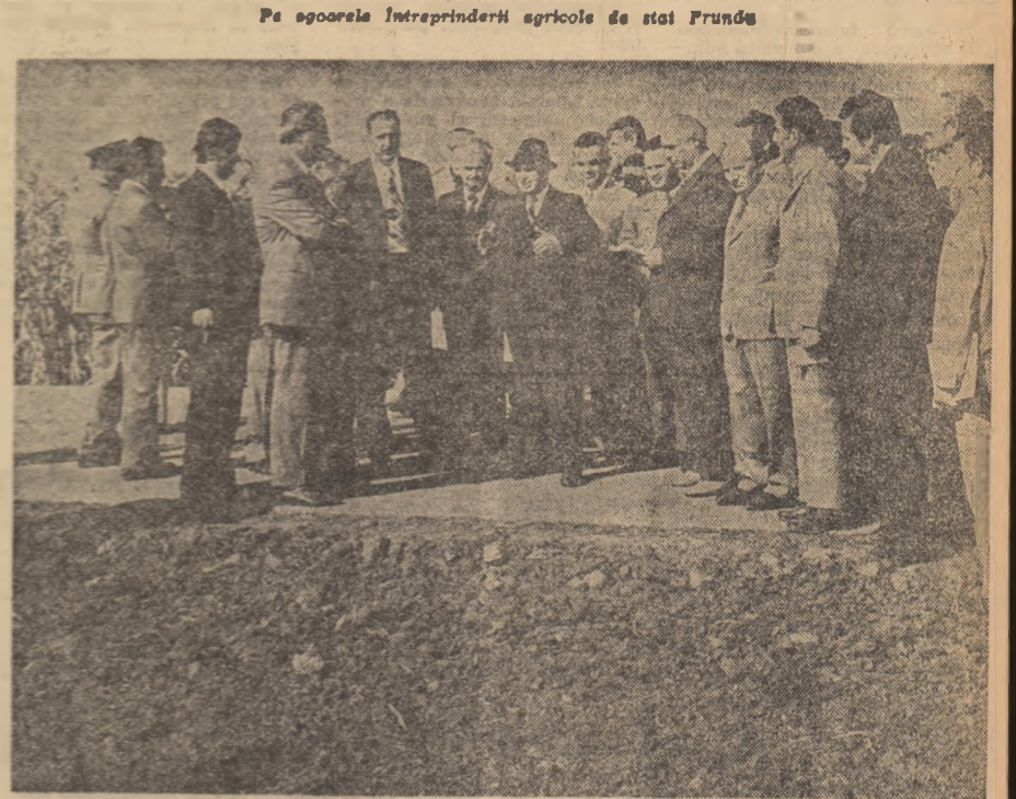
Dialog cu specialiștii Institutului de cercetări pentru irigații și drenaje Băneasa — Giurgiu.

Lucrătorii școlilor l-au înțeles și au fost foarte mulțumiți de aprecierile și îndemnul tovarășului Nicolae Ceaușescu, afirmîndu-și sentimentele de dragoste și recunoștință față de partid și secretarul său general, acuzîndu-se deplină la politica partidului și statului nostru în ceea ce privește dezvoltarea contribuției la înfăptuirea exemplară a sarcinilor ce revin agriculturii în cadrul programului de înflorire a patriei și de creștere permanentă a bunăstării celor ce muncesc.