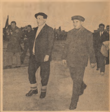
Întâlnirea prietenească dintre tovarășii Nicolae Ceaușescu și Todor Jivkov. În mijloc: Nicolae Ceaușescu și Todor Jivkov. În dreapta: Nicolae Ceaușescu și Todor Jivkov. În stânga: Nicolae Ceaușescu și Todor Jivkov.