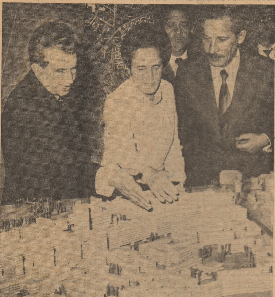
În fața machetei de sistematizare a orașului Miercurea Ciuc, se analizează perspectivele dezvoltării armonioase a acestei așezări care va deveni, prin munca oamenilor săi, un oraș modern, cu o economie puternică și un înalt nivel de civilizație.