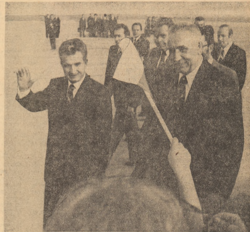
La sosire, pe aeroportul Otopeni