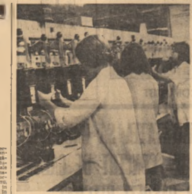
Profesor de cultură - în grupul elevilor - profesorul de la Timreș...