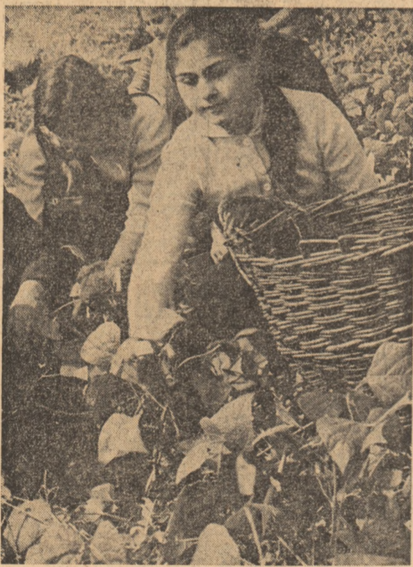
Zilnic sute de elevi sînt prezenți acum pe ogoare la recoltat. Această imagine am surprins-o pe terenurile întreprinderii de legume-fructe din Tr. Măgurele, județul Teleorman.