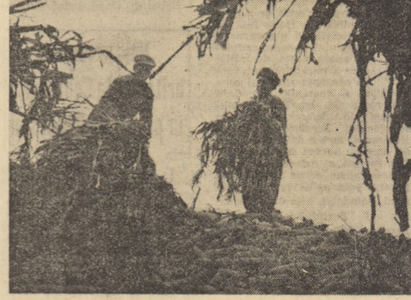
La C.A.P. Tămăduu acoperirea cu coceni a pătulelor se apropie de finalizare