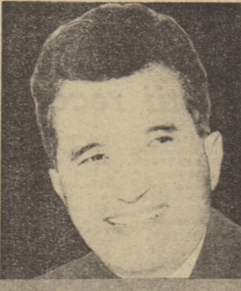
CEAUȘESCU Scritti scelti 1975 Edizioni del Calendario

În cuvântul introductiv, prof. univ. Carlo Salinari, subliniază că acesta a fost pentru România anul încheierii celui de-al cincilea plan cincinal, realizat înainte de termen. Evidențiază de asemenea că dezvoltările economice românești, se arată că în acest domeniu „toate eforturile sînt concentrate asupra transferării în viață a Programului celui de-al XI-lea Congres al P.C.R., care prevede transformarea în 1990 a României într-o țară socialistă în curs de dezvoltare, într-o țară puternic dezvoltată”.