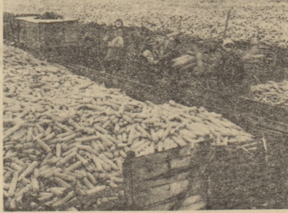
Porumbul, adus din cîmp, este imediat descărcat în platformele și pătulele dinainte amenajate în unitățile agricole, la bazele de recepție

în viață prevederile planului, pentru să nu este de ajuns doar să producem ci trebuie să știm în fiecare moment cu ce efort realizăm un produs, să căutăm de fiecare dată noi posibilități de creștere a eficienței activității noastre. Pentru că ce înseamnă să reducem cu cel puțin 30 la sută costul investițiilor din acest cincinal, ca să ne oprim doar la un singur exemplu, deci crearea unor fonduri suplimentare cu care să construim în plus, așa cum s-a stabilit recent, peste 160.000 locuințe noi, ci eva zeci de obiective economice mai puțin dezvoltate.