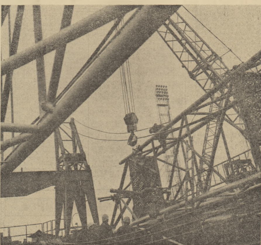
La întreprinderea „1 Mai” din Ploiești se lucrează la montarea unei noi turle pentru foraj.