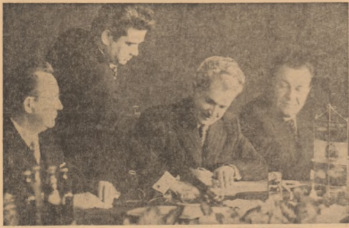
Grupuri de tineri discutând problemele de învățare în cadrul de la Moscova.

ORGAN CENTRAL AL UNIUNII TINERETULUI COMUNIST