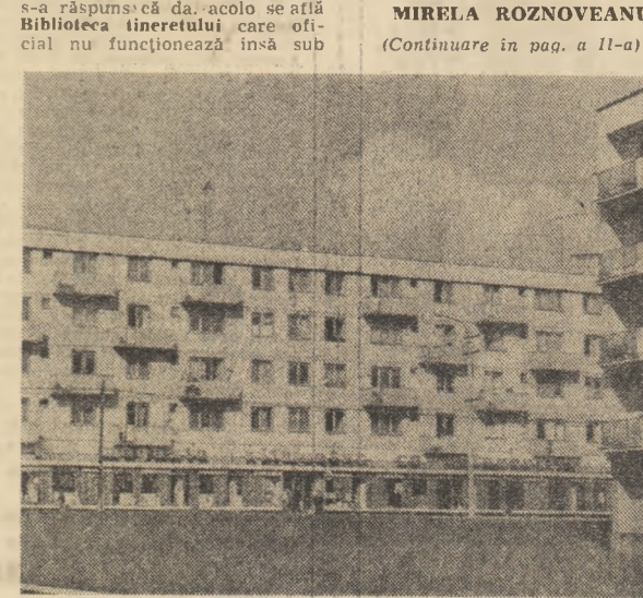
Noi construcții la Zalău