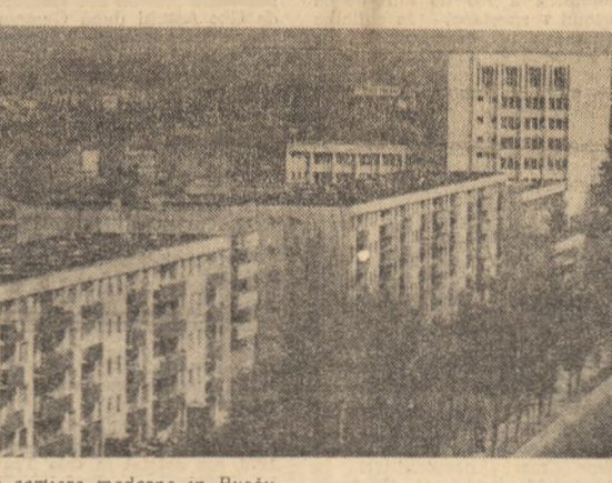
Noi cartiere moderne în Buzău