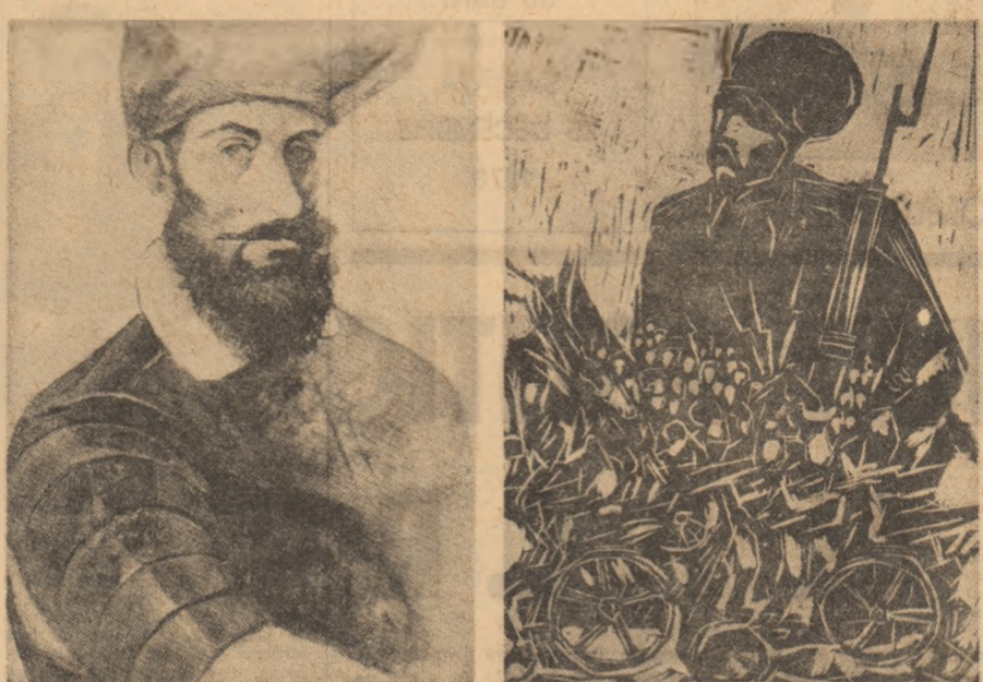
DAN BIMBEA — „Mihai Viteazul” ERNEST SCHULLER — „În luptă” (1877)