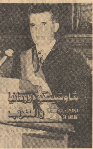
CEAUȘESCU ROMANIA SI ARABII

Una din cele mai grăitoare expresii ale interesului manifestat față de România este editarea în tot mai multe țări a lucrărilor secretarului general al partidului nostru, președintelui Republicii Socialiste România, tovarășul Nicolae Ceaușescu. Numai în acest an asemenea cărți au văzut lumina tiparului în limbile italiană, greacă, turcă, arabă și ebraică, prezentările lor publicului larg transformatându-se în veritabile manifestări ale prieteniei care ne leagă de popoarele respective. Elogiile exprimate cu aceste prilejuri la adresa României, a președintelui său, de înalte personalități politice constituie o mărturie clară a stimei și prețuirii deosebite cu care este pronunțat astăzi numele țării noastre pe toate meridianele Terrei.