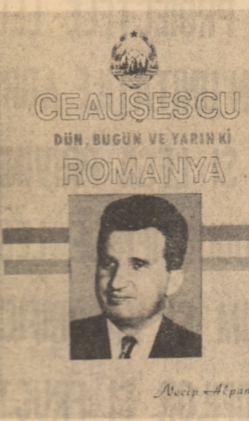
CEAUȘESCU DÎN, BUGUN VE YARIN KI ROMANYA