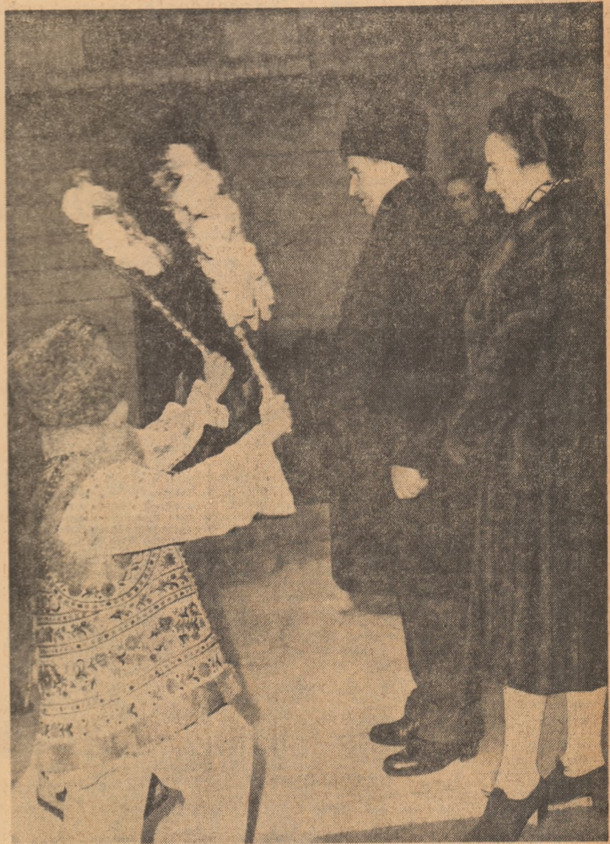
nierilor, elevilor, studenților și, prin ei, întregului nostru tineret.

Ca la flecare tradițională în- flinire de Anul Nou, secretarul general al partidului, președin- tele țării, tovarășul NICOLAE CEAUȘESCU, se adresează plo-