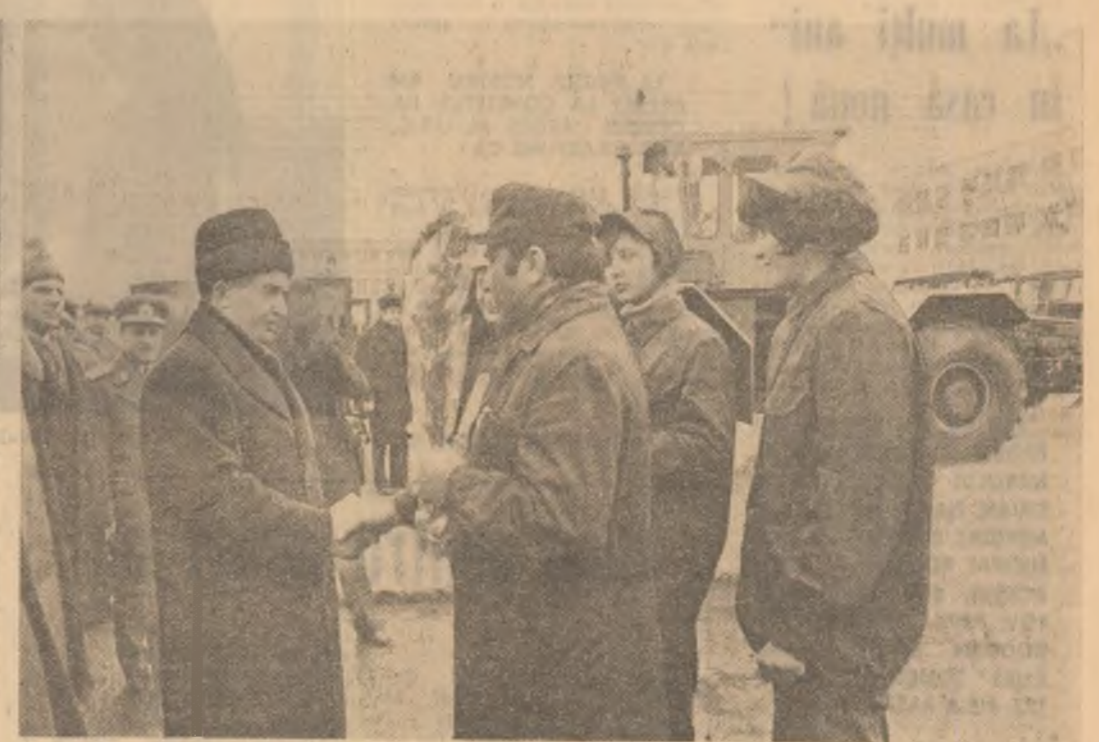
Colectivele muncitorilor craioveni fac o călduroasă primire secretarului general al partidului

Însuflețiti de această vibrație chemare spre noi împliniri, locuitorii Craiovei, ai județului Doj au pășit în 1977 — asemenea întregii națiuni — cu optimism și încredere, cu voința fermă de a munci mai bine și mai spornic, de a-și îndeplini exemplar sarcinile de răspundere ce le revin, de a întâmpina marile evenimente ale anului cu realizări de seamă în activitatea consacrată, îndeplinirii hotărîrilor Congresului al XI-lea al partidului și a Programului de edificare a societății socialiste, multilateral dezvoltate și de înaintare a României spre comunism.