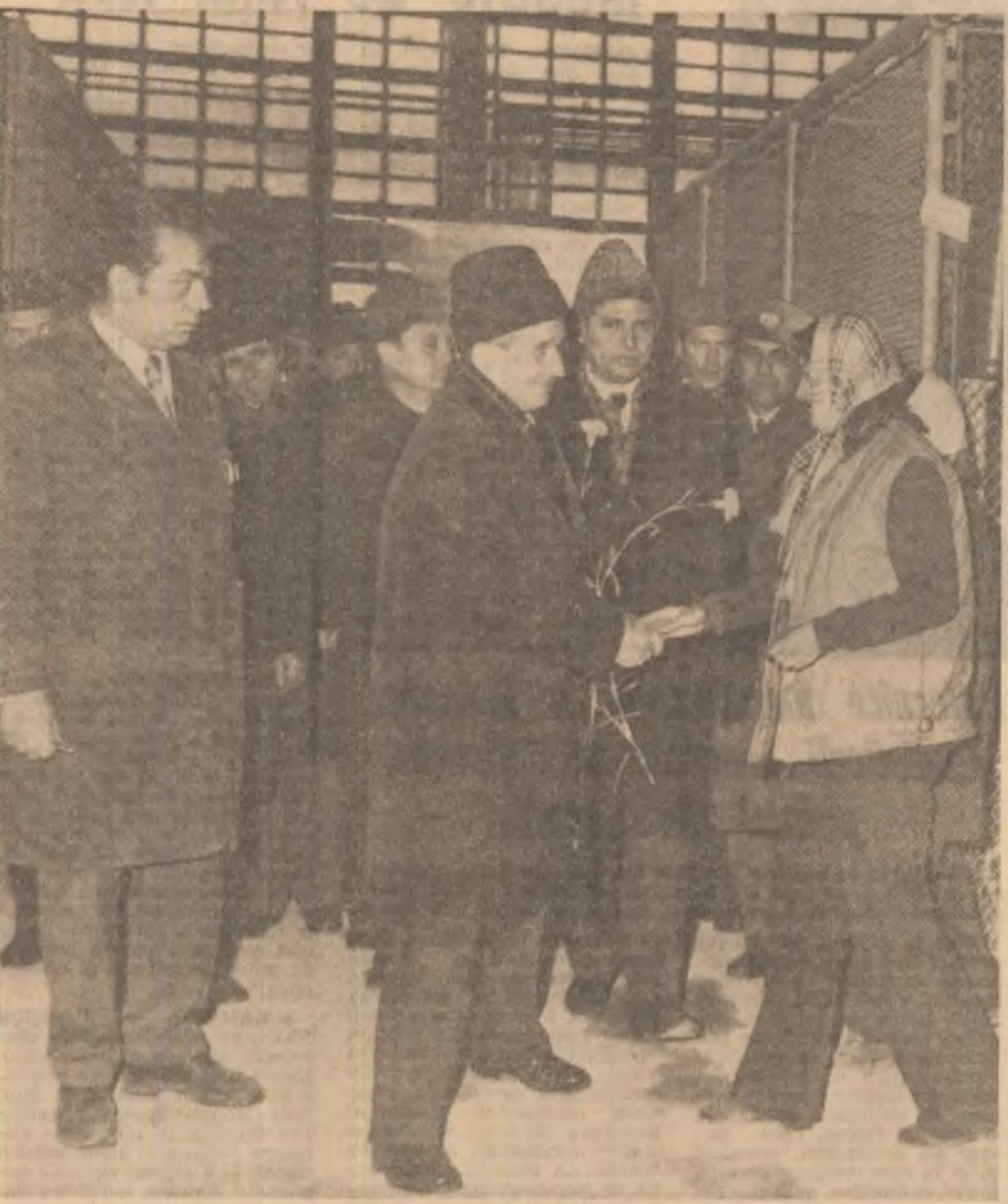
(Urmare din pagina 1)