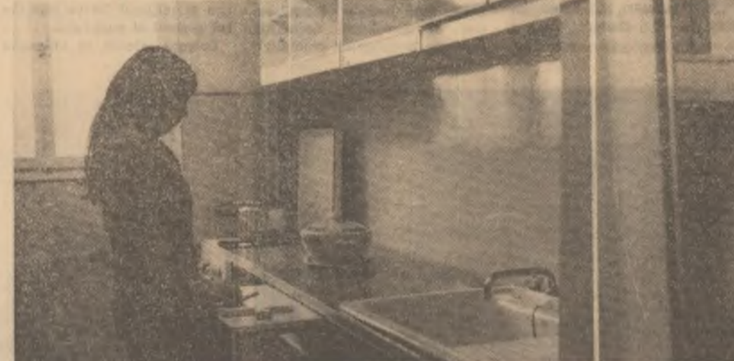
O soluție practică — dulapurile înzidite ale holurilor

DOMNIȚA VĂDUVA Mobiila de bucatărie ocupă mai puțin de 30 la sută din spațiu