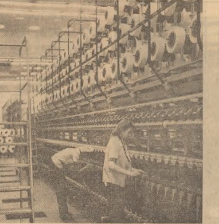
R. P. POLONA. Aspect dintr-o secție a fabricii de fibre sintetice „Stilon” din localitatea Gorzów