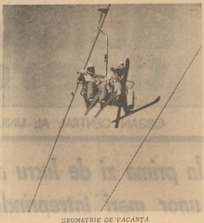
GEOMETRIE DE VACANȚĂ