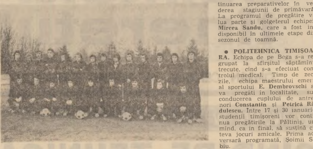
Lotul național înaintea primului antrenament la Complexul sportiv „23 August”