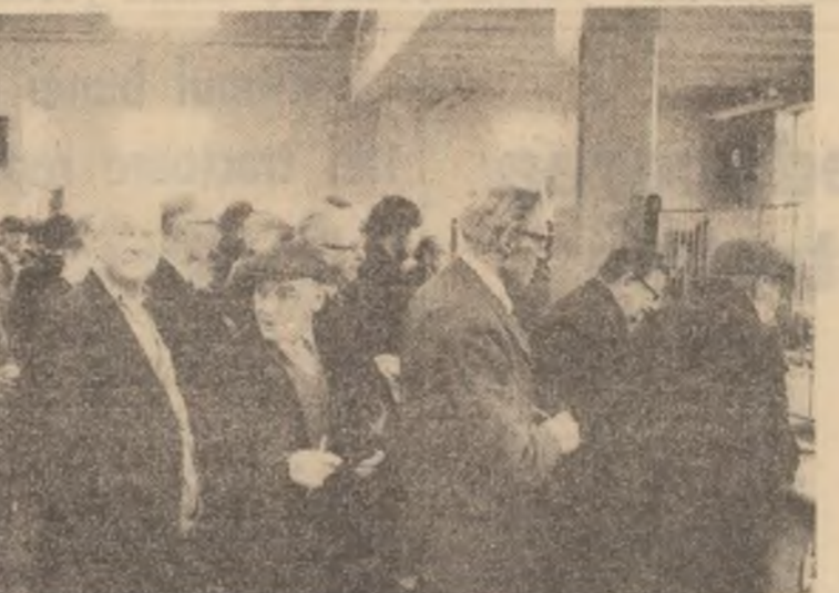
Raportul dat publicității de Organizația pentru Cooperare Economică și Dezvoltare (O.E.C.D.) relevă că perspectivele în domeniul șomajului în țările membre sînt sumbre...