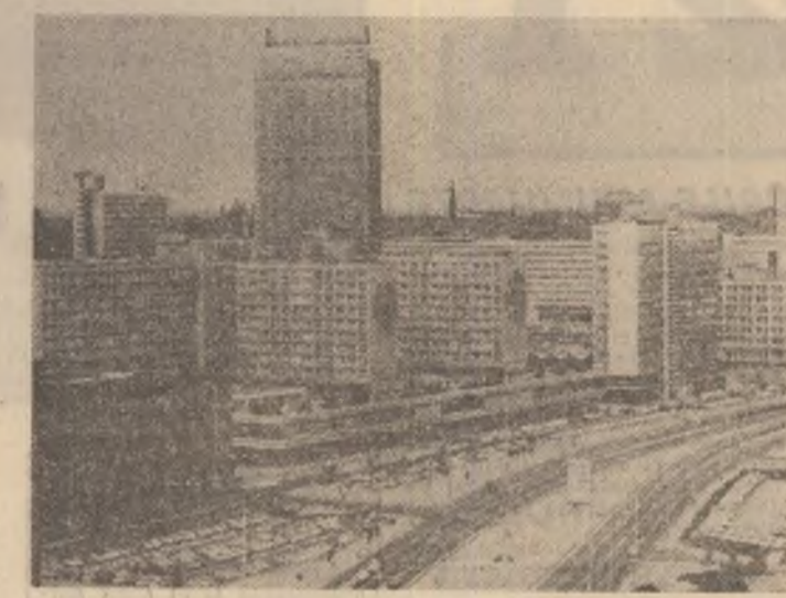
R. D. GERMANĂ. Imagine din centrul capitalei, Berlin