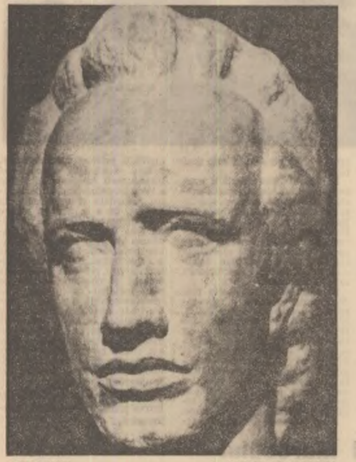
EMINESCU — de CORNELIU MEDREA