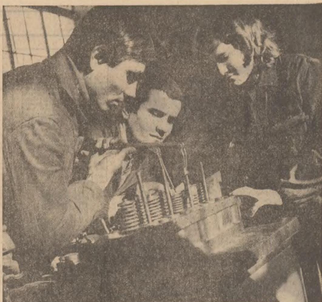
Elevi de la Liceul Industrial nr. 2 Buzău, în atelierul de practică școlară

Din întreaga țară sosesc la redacție vesti despre dezvoltarea urbanistică a localităților, despre noile obiective sociale puse la dispoziția beneficiarilor în acest an. Celor aproape 1.200 de apartamente construite pînă acum la Rim Sărac, oraș devenit în ultimii ani un important centru industrial, li se vor adăuga, în acest an, alte 800 apartamente și garsoniere, precum și cîmpine pentru nefamiliști însumind circa 900 de locuri. În cei mai noi ansamblu de locuințe din Floiești, cartierul „Bariera Bucov”, au fost date în folosință primele 80 de apartamente din planul pe acest an.