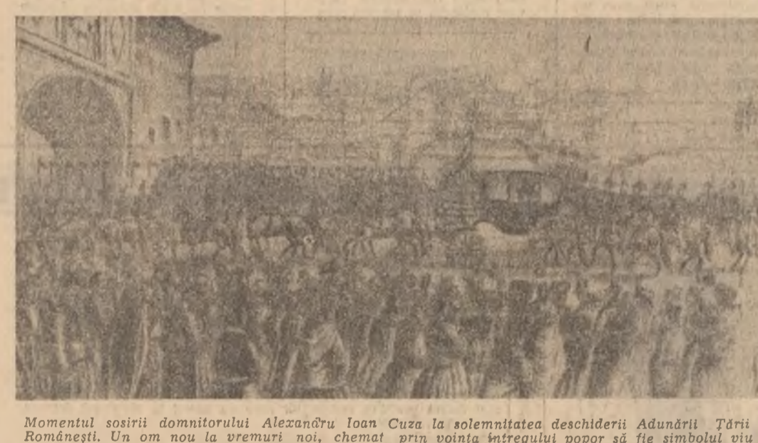
Momentul sosirii domnitorului Alexandru Ioan Cuza la solemnitatea deschiderii Adunării Țării Românești. Un om nou la vremuri noi, chemat prin voința întregului popor să fie simbolul viu al împlinirii unui ideal străvechi.

„Cheia de boltă a edificiiului național” — „Cheia boltii fără care s-ar prăbuși edificiul național”, cînd mulțimea adunată pe Cîmpia Blajului cerea ca un singur om: „Noi vrem să ne unim cu Țara”, toate acestea — și multe altele — reprezintă mărturia ale unanimității de aspirații pe care revoluția română de la mijlocul secolului trecut a pus-o pînă în evidență. Imprejurări istorice potrivnice n-au permis atunci, la 1848, izbînda măreței cauze, dar ele n-au putut împiedica desfășurarea unui proces legic, cu puternice rădăcini în noască dreptul poporului român de a fi constituit cu privire la viitorul său. Și poporul s-a pronunțat. Adunările ad-hoc din Muntenia și Moldova — cele dintîi reprezentanțe naționale în care au fost aleși și deputați țărani — s-au rostit în unanimitate pentru unirea țării.