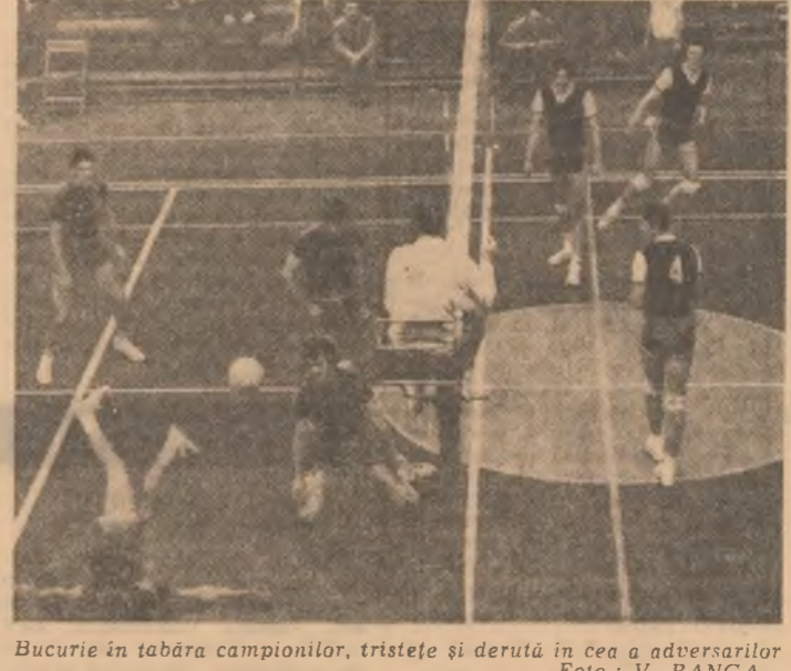
Bucurie în tabăra campionilor, tristețe și derută în cea a adversarilor