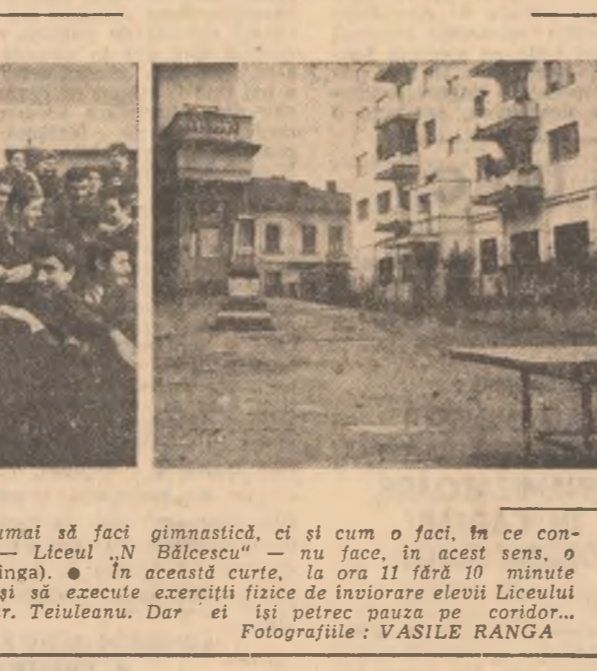
● Nu este important numai să faci gimnastică, ci și cum o faci. În ce condiții! Aceasta imagine — Liceul „N. Bălcescu“ — nu face, în acest sens, o pledoarie convingătoare. (stînga). ● În această curte, la ora 11 fără 10 minute ar fi trebuit să se afle și să execute exerciții fizice de învioreare elevii Liceului economic — clădirea din str. Teiuleanu. Dar ei își petrec pauza pe coridor... (dreapta).