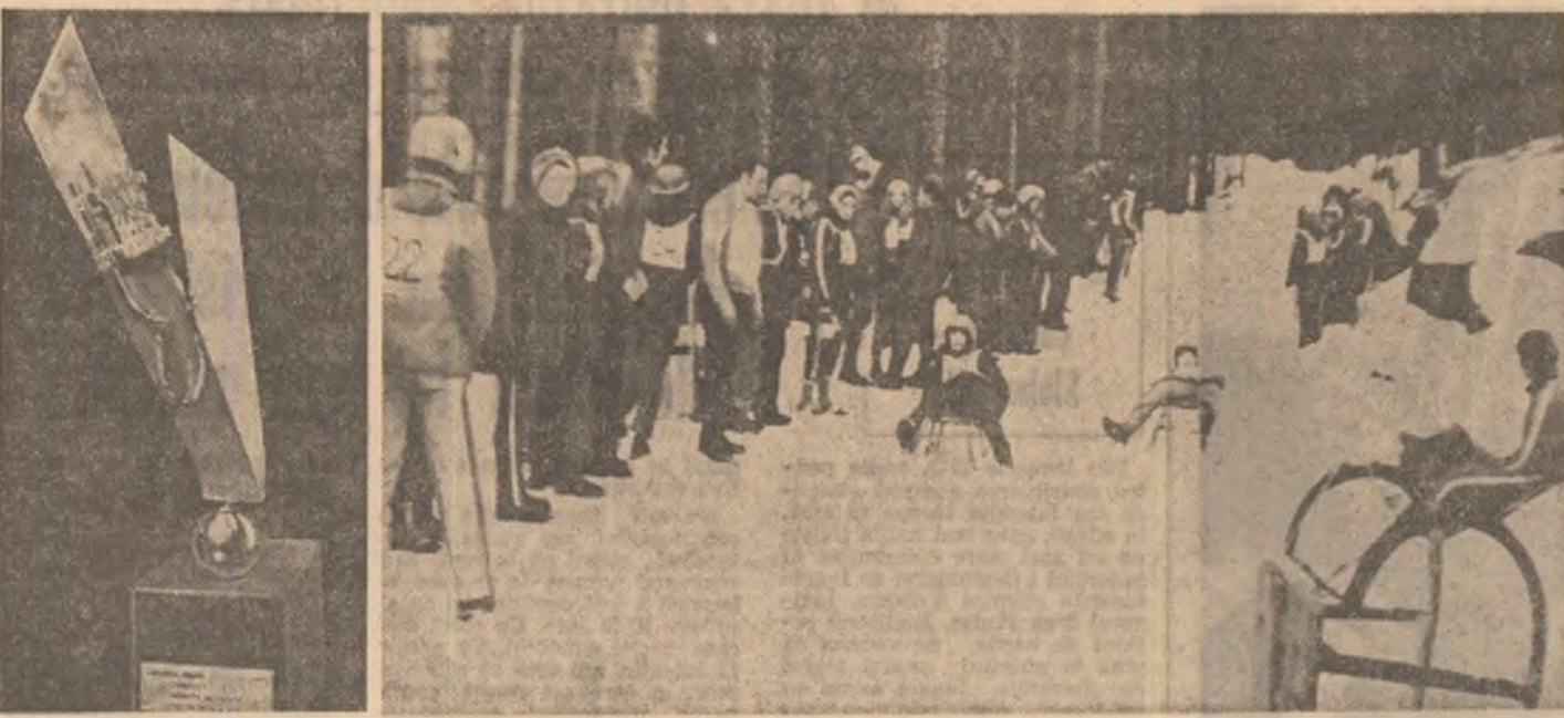
A 9-a ediție a popularei întreceri a elevilor