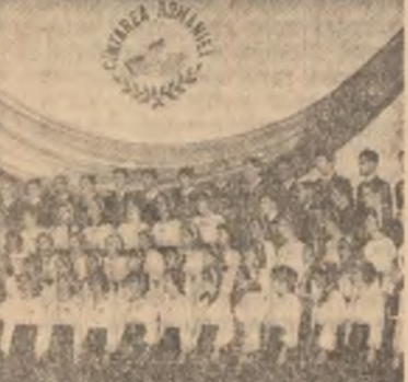
Corul Liceului „Mihai Viteazu” Ploiești

În sala noli și monumentală Case de cultură a sindicatelor au fost trecute în revistă formațiile corale, grupurile vocale, solistii instrumentiști și so-