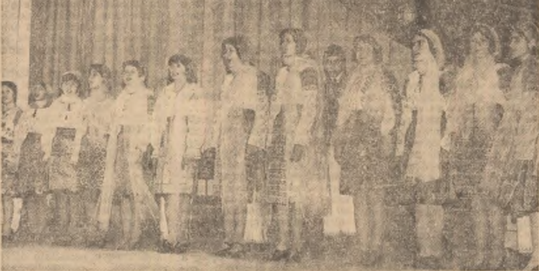
Grupul folcloric al Liceului Industrial „I. Mai” Ploiești

Tinerii din orașul Ploiești au susținut recent faza municipală a Festivalului „Cîntarea României”. Circa 10.000 de elevi, ilustrînd elegant amploarea forțelor antrenate în concurs, au luminat scenele orașului cu flacăra vie a talentului și a dăruirii lor tinerești. Timp de o jumătate de zi la Palatul de Cultură s-a desfășurat cîntecul și poezia, a teatrului și a dansului. Mil de glurii tinere au adus în avîntate versuri primos recunoscîntă parții și participarea, poporul, povestea cu emoție momente glorioase din istoria țării.