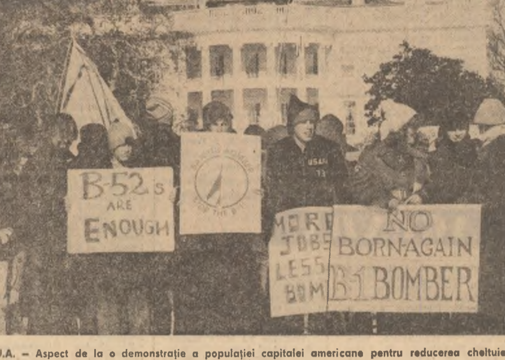
S.U.A. - Aspect de la o demonstrație a populației capitalei americane pentru reducerea cheltuielilor militare

RETAGEREA DE LA „EST DE SUEZ” : ULTIMUL ACT. Ultima hază britanică aflată la est de Suez, cea de la Masirah, în sultanatul Oman, va fi închisă la 31 martie - s-a anunțat oficial la Londra.