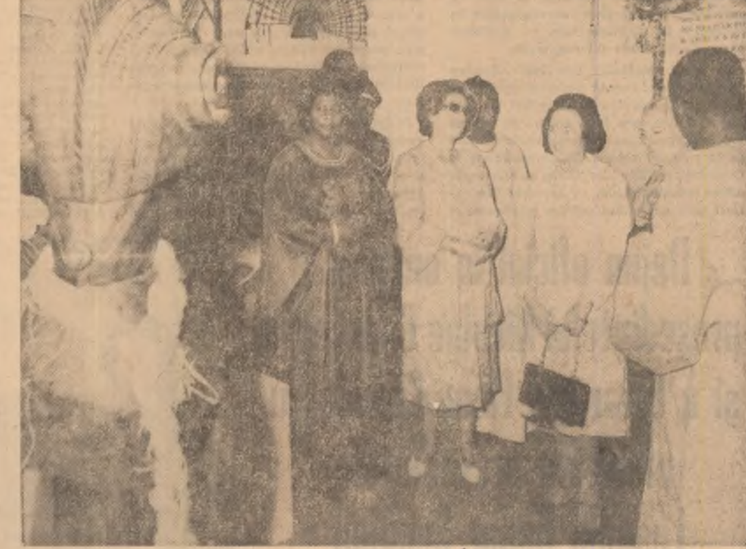
sculptura în piatră. Obiectele de artă din Benin se împun prin coloritul viu și bogat. Măști și statui din vestul Nigeriei, îmbrăcate în piele de antilopă, reflectă varietatea plastică și stilul specific artei nigeriene.