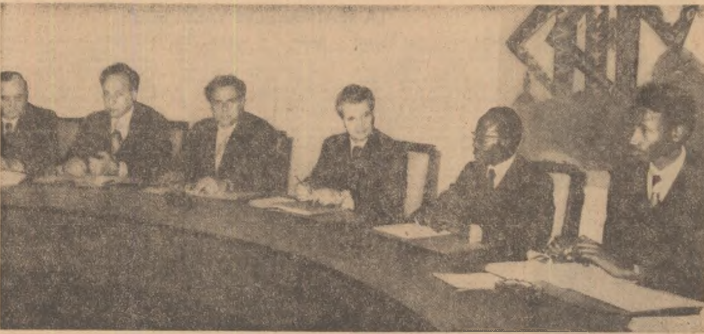
În timpul convorbirilor oficiale