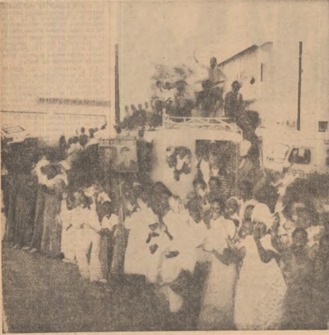
Imagine semnificativă pentru ambianța, căldura și ospitalitatea cu care locuitorii Dakarakului i-au primit pe înalții oaspeți români.