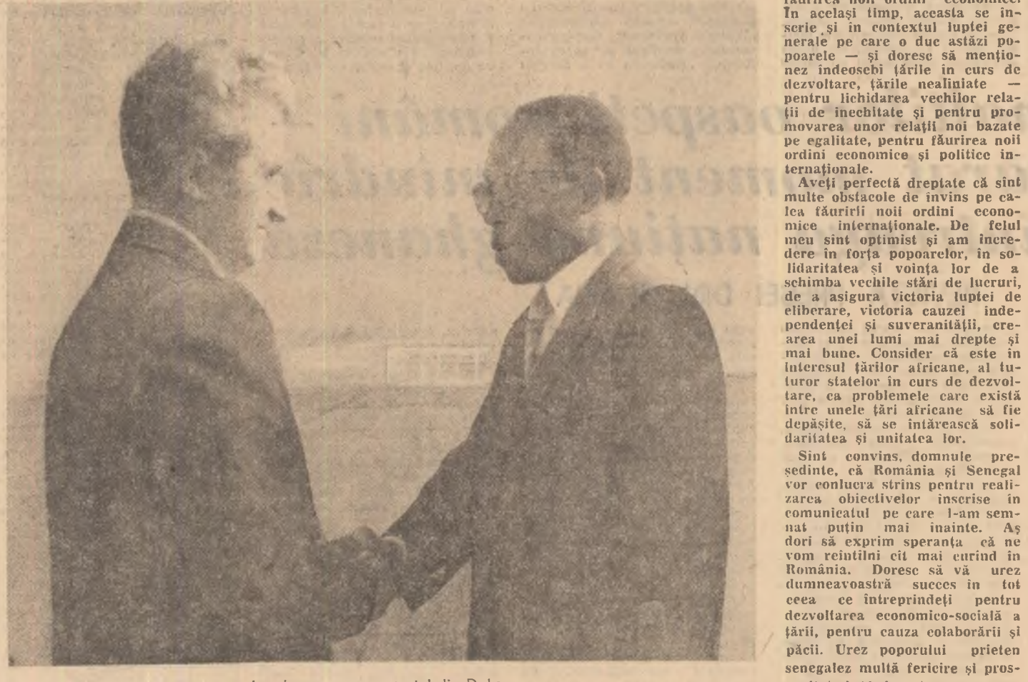
La plecare, pe aeroportul din Dakar

Domnule șef al statului, președinte al Consiliului Militar Suprem al Republicii Ghana, Vă mulțumim pentru primirea călduroasă și pentru cuvintele de salut și de bun venit pe care ni le-ați adresat. Dorim să vă adresăm dumneavoastră, și prin dumneavoastră întregului popor prieten gheanez un salut călduros și cele mai bune urări. Fiind prima vizită la acest nivel, as dori ca ea să marcheze un moment nou în relațiile dintre România și Ghana, să deschidă perspectivele unei cooperări largi în toate domeniile de activitate. România, țară socialistă în curs de dezvoltare, depune eforturi mari pentru a obține progrese pe calea construcției societății socialiste și, totodată, dezvoltă larg relațiile de cooperare cu alte state, acordînd un loc important țării în curs de dezvoltare. Cunoaștem eforturile făcute de