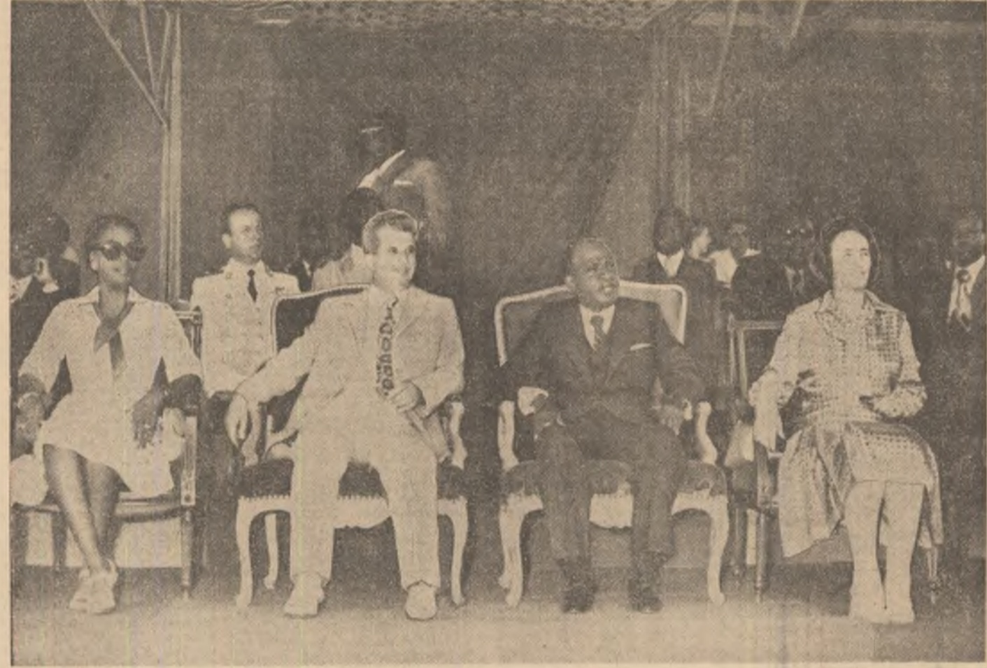
În timpul adunării populare de la Yamoussoukro

El au subliniat, deosebit, necesitatea dezvoltării relațiilor dintre state pe baza respectării principiilor suveranității și independenței naționale, egalității în drepturi și al respectului reciproc, al nemeștecului în treburile interne ale altor state, al renunțării la utilizarea forței sau la amenințarea cu forța, al integrității teritoriale și inviolabilității frontierelor, soluționării tuturor problemelor prin mijloace pașnice.