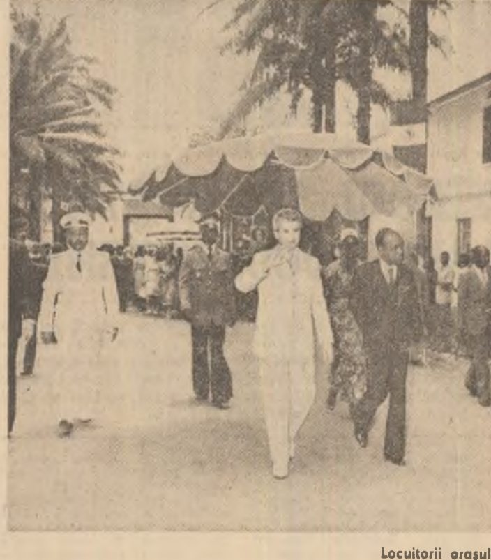
Locuitorii orașului Yamoussoukro au întâmpinat cu deosebită căldură pe înalții soli ai poporului român

„Toată populația din zona centrală a țării și-a dat întâlnire marți la Yamoussoukro pentru a primi într-o atmosferă de entuziasm, așa cum sint primii oaspeți cei mai de seamă, pe președintele României, Nicolae Ceaușescu, și pe distinsa soție, doamna Elena Ceaușescu. Prin această primire făcută oaspeților români, poporul ivorian a dat expresie deplină dorinței sale de a conlucra și coopera cu România socialistă în scopul prosperității popoarelor noastre. Au venit în întâmpinarea marelui om de stat locuitorii din Bouaké, Bouafia, Daloua, Dimbroko și din alte departamente administrative ale țării, pentru a întinde mîna poporului român, care, prin președintele său, ne-a trimis solia sa de pace, dorința sa de trai în înțelegere cu toate popoarele lumii. În numele prieteniei româno-ivoriene, între-