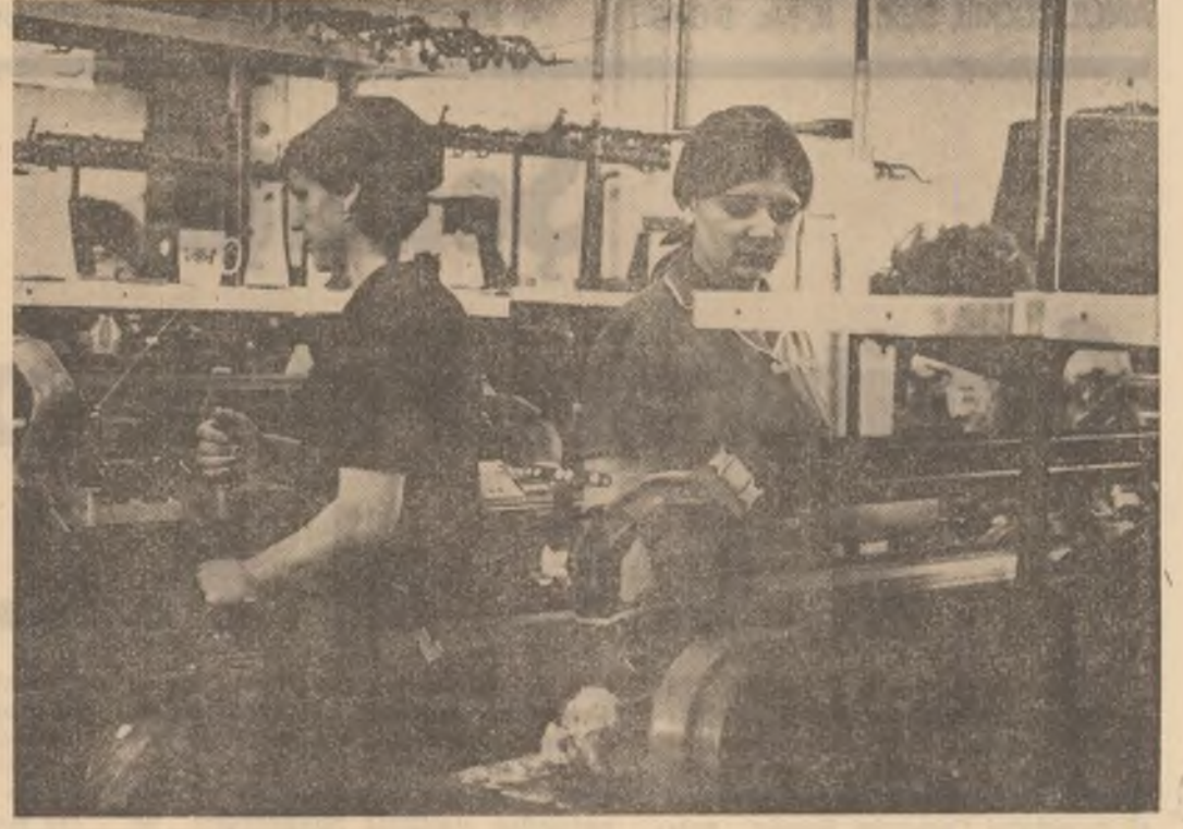
Mașinile de tricotate și-au reluat ritmul firesc de lucru.