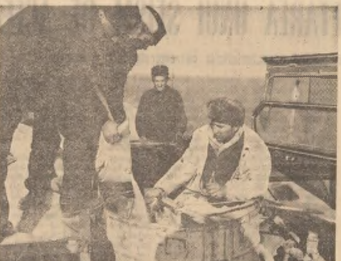
Mecanizatorii trec pe la platforma de aprovizionare cu îngrășăminte chimice. Fertilizarea solului — o lucrare de primăvară urgentă.

În toate unitățile agricole din județul Iași, campania agricolă a fost declanșată. Au fost arate pînă acum peste 30 000 ha de pămînt, însămîntate cu mazăre și rădăcinăsoase 1 000. A început, de asemenea, drenarea apelor