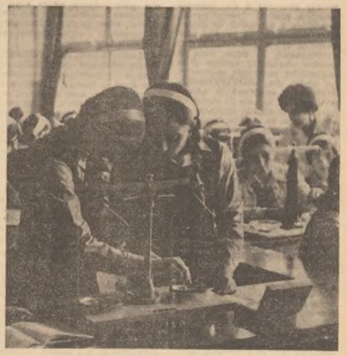
Ord de laborator la Liceul economic nr. 1 din Capitală

Conștienții de importanța contribuției lor la refacerea zonelor grav afectate de cutremur tinerii de la întreprinderea „Ceramica” din Jimbolia, județul Timiș, și-au organizat munca în schimburi prelungite în toate secțiile. A fost astfel pusă în funcțiune și cea de-a doua secție de cărămidă care în mod obișnuit lucrează numai în perioada de vară. Ca urmare, pînă la sfîrșitul acestei luni se vor realiza suplimentar 1 milion bucăți cărămizi echivalente, cantitate egală cu necesarul a 30 apartamente.