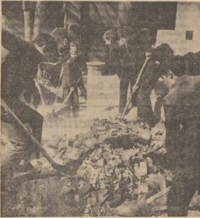
Brigăzile de elevi înlătură ultimele grămezi de moloz.