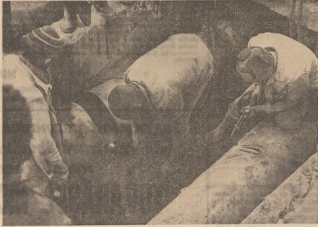
În cartierul Militari, echipe speciale de instalatori remediază stricăciunile la conductele de apă caldă.