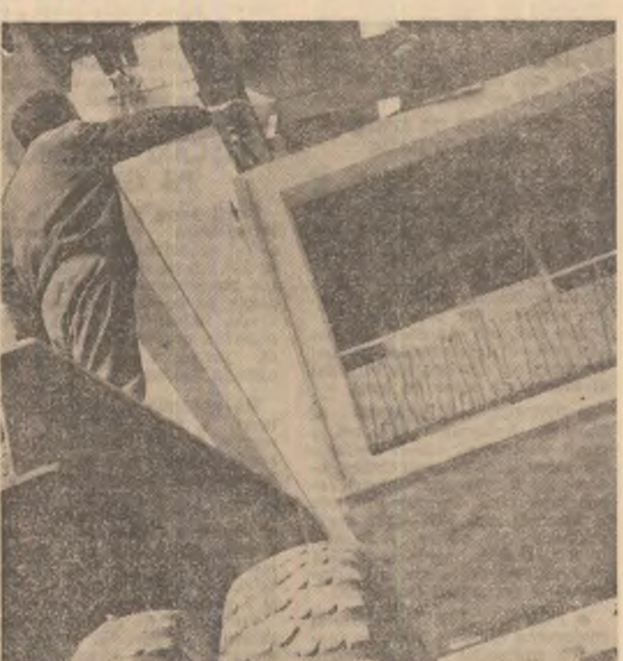
INTREPRINDEREA DE PREFABRICATE DIN BETON - CRAIOVA:

La fiecare 24 de ore, panouri pentru șapte apartamente