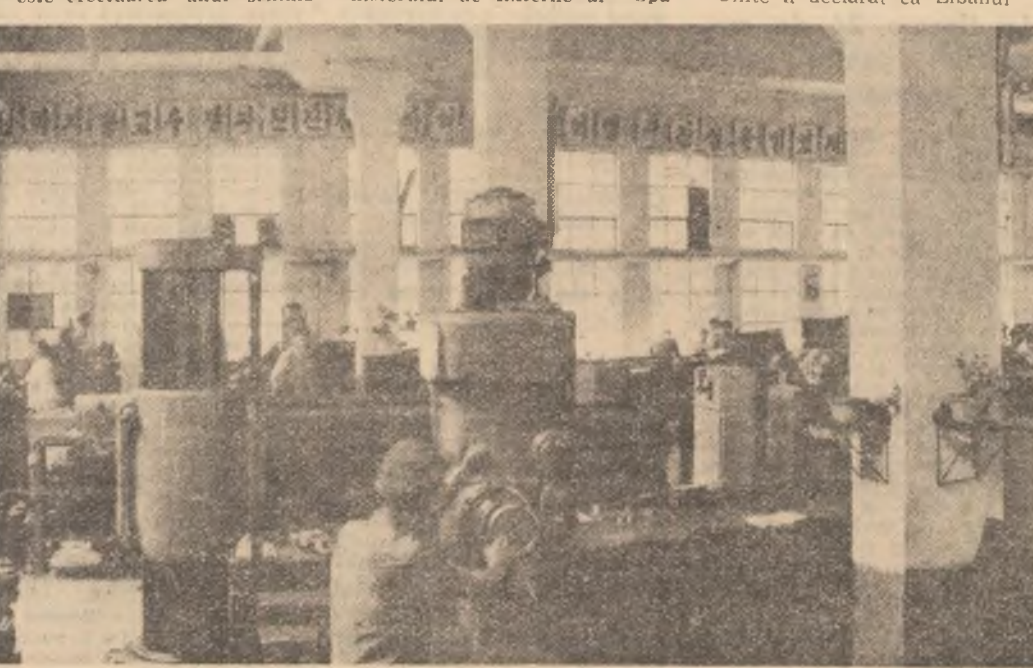
R.P.D. COREEANĂ: Aspect de muncă dintr-una din fabricile Uzinei de utilaj minier din Tcharyngwan

● UN COMUNICAT al Ministerului de Externe al Spa-