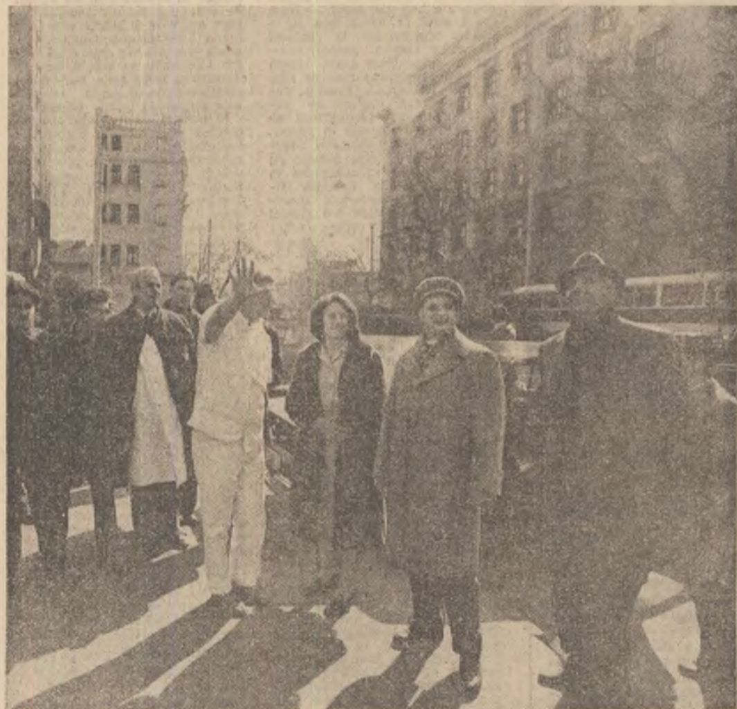
La Spitalul de urgență

rie, precum și cu terase supra-dimensionate. A fost criticat, de asemenea, faptul că în stâlpii de beton au fost săpate lăcăsuri pentru instalarea unor rețele de țevi, fapt care a diminuat puterea de rezistență a structurilor clădirii. Aceste deficiențe au apărut și mai mult în evidență în comparație cu clădirea învecinată a Spitalului de boli cardiovasculare, o construcție mai simplă, fără încărcături inutile, care a rezistat cu bine solicitărilor seismului și, în consecință, funcționează în mod normal. În spiritul preocupării permanente a partidului nostru pentru îmbunătățirea asistenței medicale de specialitate au fost discutate o serie de aspecte ale sistematizării complexului spitalicesc de la Fundeni, unde, în afară de unitățile existente, urmează să se construiască un centru de oncologie și un nou spital modern de urgență profilat pe afecțiunile provocate de accidente grave. Cu acest prilej, tovarășul Nicolae Ceaușescu a recomandat să se studieze cu atenție toate aspectele legate de construirea și amenajarea noilor unități spitalicești de la Fundeni, să se țină seama, totodată, și de necesitatea ca acestea să devină, totodată, centre de specializare și perfecționare a cadrelor medicale. (Continuare în pag. a III-a)