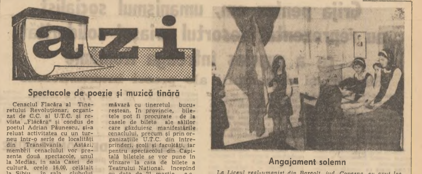
Spectacole de poezie și muzică tânără