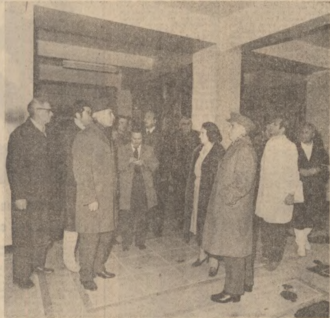
La Spitalul Fundeni