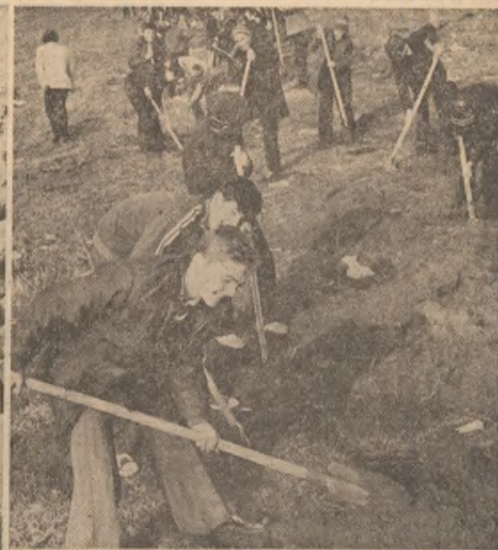
La Focșani, București, Roșiori' de Vede, Craiova — ca și în celelalte locuri ale traseului reportajelor noastre, uteciștii, tinerii muncitori, elevi, studenți au fost în primele rînduri.

Vrancea — Buzău — Prahova — București — Teleorman — Olț — Dolj: Pe unda de șoc a seismului, pentru înlăturarea grabnică a urmărilor, pentru recuperarea pagubelor suferite — UNDA EROICĂ A MUNCII ȘI DĂRUIRII PATRIOTICE • ÎN CAPITALĂ, ALĂTURI DE MILE DE CETĂȚENI AI ORĂȘULUI AFLAȚI LA LOCURILE DE MUNCĂ, PESTE 60 000 DE TINERI, MOBILIZAȚI DE ORGANIZAȚIILE U.T.C. AU FOST PREZENȚI PE TOATE FRONȚURILE REFAKERII (amplu relatări ale reporterilor noștri despre activitatea în industrie, agricultură, acțiunile brigăzilor uteciste care au avut loc în cursul zilei de ieri, în paginile 2 și 5)