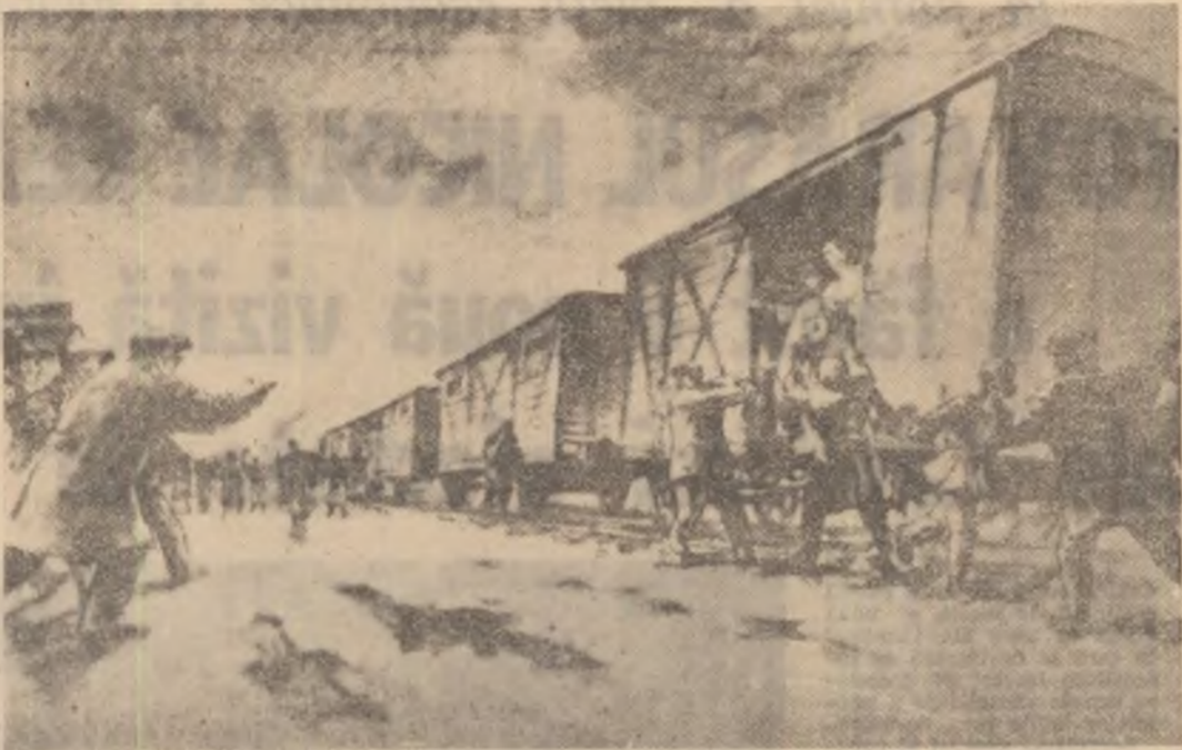
Pașcani, 1907: Muncitori eliberând țărani răsculați din trenurile care-i duceau spre locurile de execuție