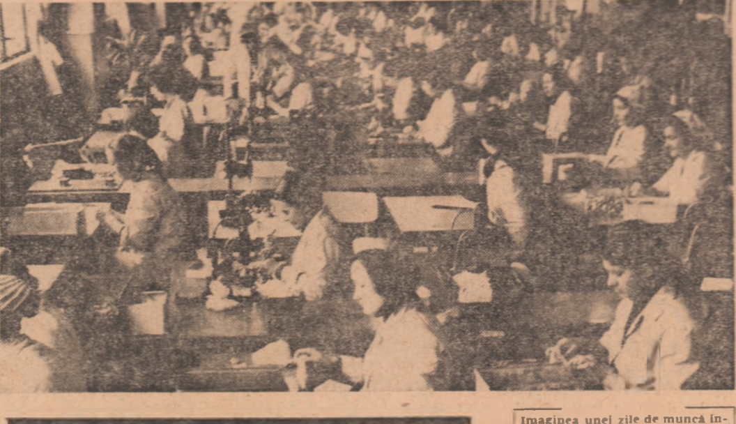
Din cronica întrecerii uteciste