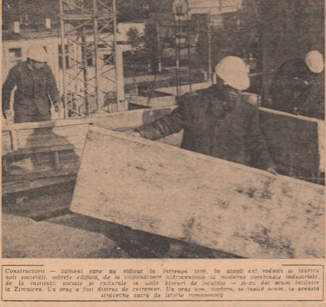
Constructorii — oameni care au ridicat în întreaga ţară, în aceste zile rodicioase şi furtivo noi societăţi, mîreţe edificii, de la staţiunile hidrocentrale la moderne combinat industriale, de la instituţii sociale şi culturale la toate blocurile de locuinţe — au dat acum iniţiativa la Zimnicea. Un oraş a fost distrus de cutremur. Un oraş nou, modern, se înalţă acum în această străveche cetate de istorie românească