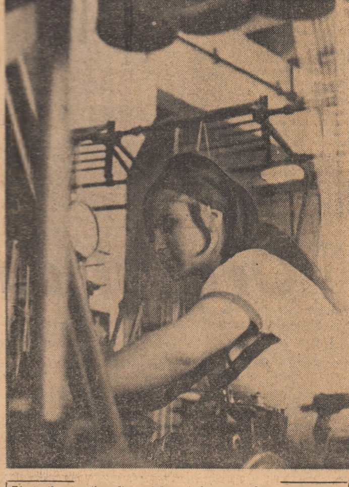
Eforturile tinerilor din unităţile industriale ale oraşului Zimnicea se desfăşoară pe două fronturi: participînd activ la lucrările de reconstrucţie, ei muncesc totodată cu dăruire pentru îndeplinirea exemplară a sarcinilor de plan

N-au mai rămas pe stradă... dar ne place să-l vedem în faţa sa... Cînd oraşul va fi reconstruit va reveni şi liniştea şi tîna lui.