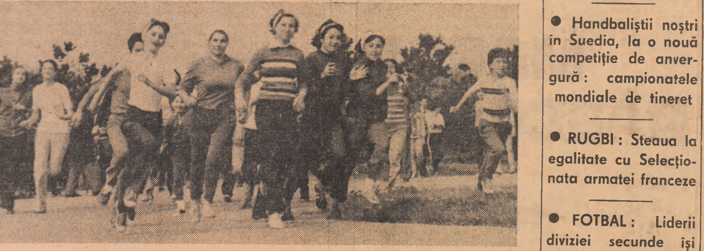
În organizarea Clubului sportiv al municipiului Bucureşti, s-a disputat duminică, în împrejurimile Clubului Tehnic, o interesantă competiţie de cros dedicată Zilei Independenţei

Timp de două zile, respectiv sîmbătă şi duminică, s-au desfăşurat la Oradea, în sala de sport a Armatei, intrecerile finale din cadrul competiţiei de masă organizate de U.T.C. şi dotată anul