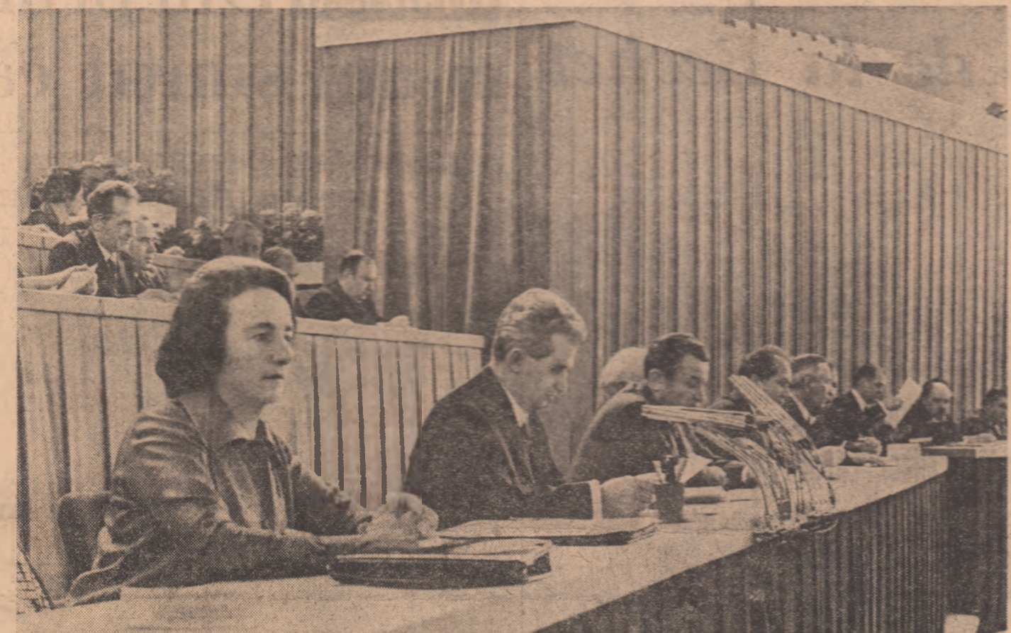
dețul Constanța, Marin Preda, scriitor.