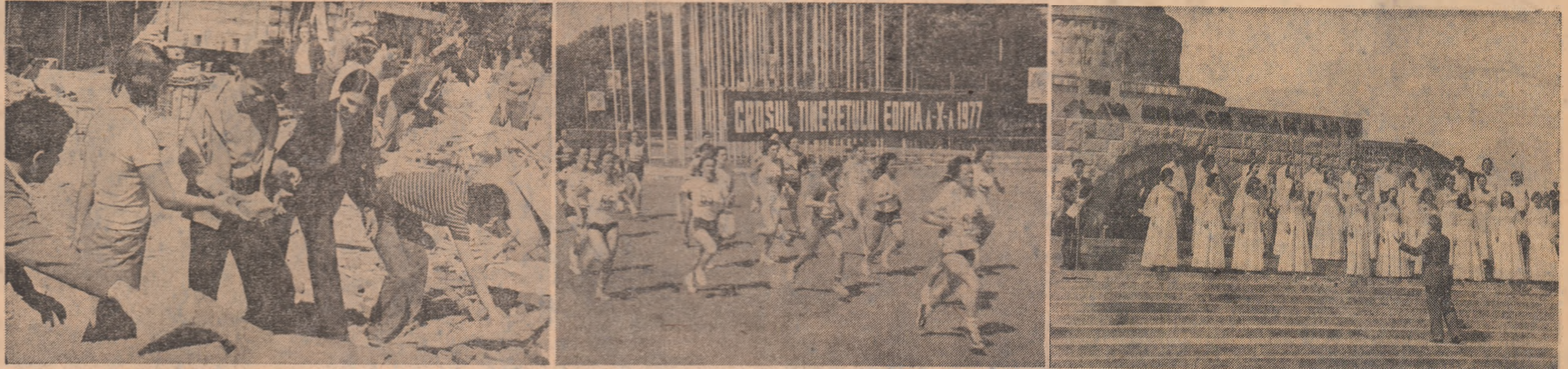
Munca, activitatea cultural-artistică și sportul - trei imagini semnificative din agenda Zilei Tineretului, trei din atributele unei tinereți careia i se oferă cele mai minunate condiții de dezvoltare și afirmare multilaterală