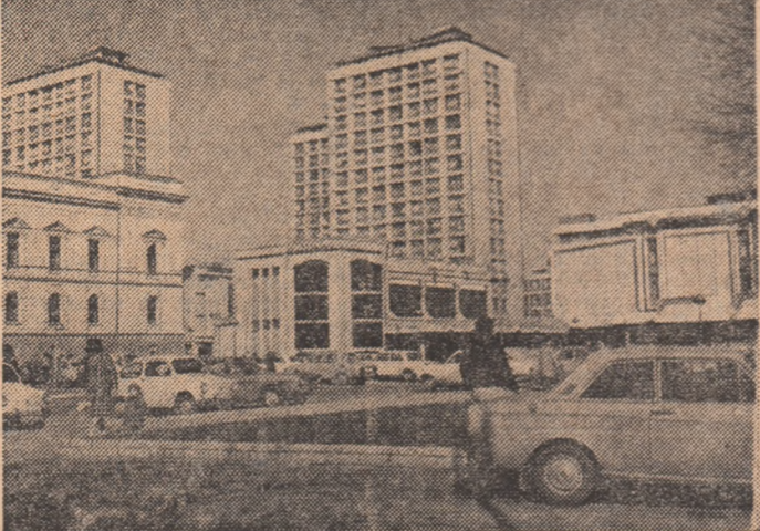
R.S.F. IUGOSLAVIA — Imagine din orașul Kragujevac, important centru industrial al Serbiei

Cu prilejul unui miting organizat la Istanbul de Confederația sindicatelor muncitorilor progresiste (D.I.S.K.), au avut loc incidente sordide, provocate de grupuri extremiste, care au atacat participanții la miting. Ca urmare a acestei situații, guvernul turc a anunțat duminică seara într-o sesiune de urgență, pentru a se stabili măsurile destinate să pună capăt actelor de violență. După reținerea guvernului, președintele Süleymen Demirel a declarat că „dacă incidentele au avut ca scop sabotarea alegerilor generale din 5 iunie, încercarea a eșuat, deoarece nimic nu poate împiedica desfășurarea acestora”.