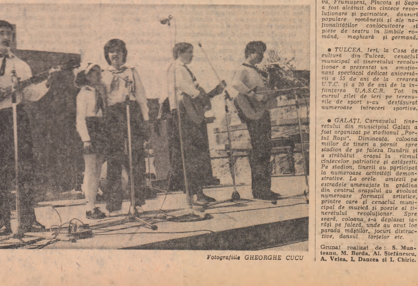
Fotografiile GHEORGHE CUCU