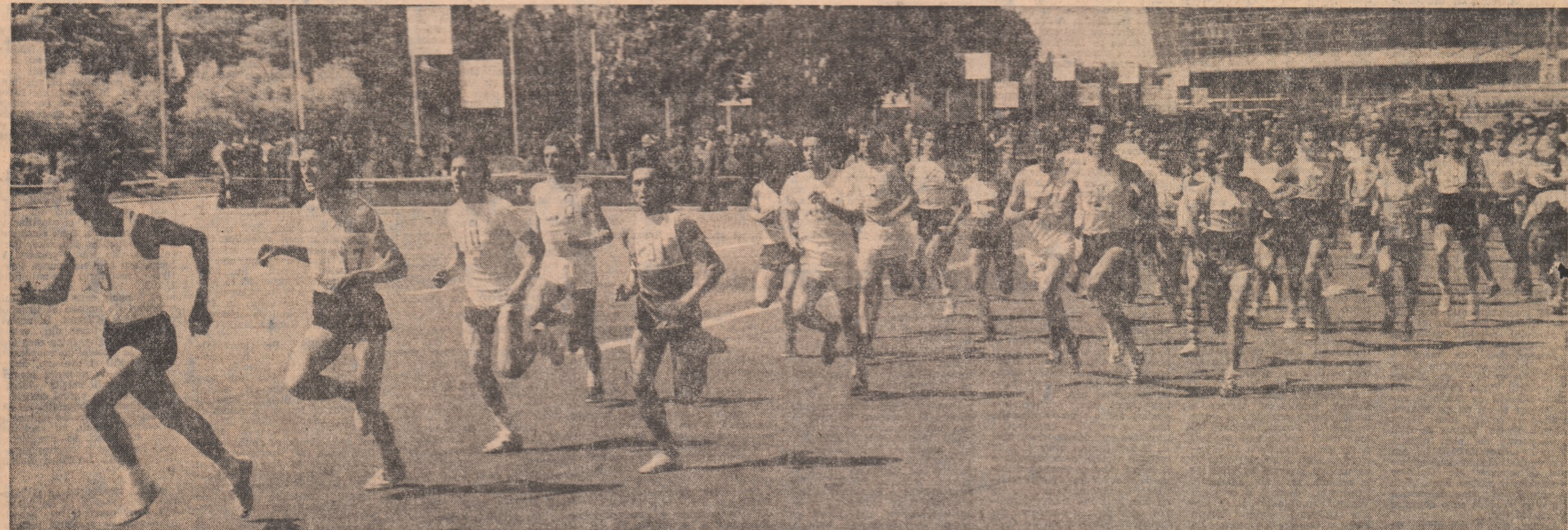
Programul polisportiv de la Pavilionul expozițional „Casa Scintei”

Grupaj documentar realizat de SERBAN CIONOFF