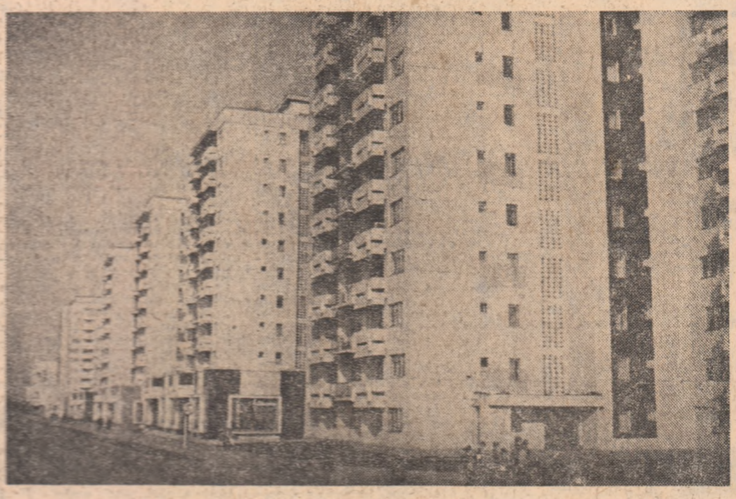
Blocuri moderne în Alba Iulia

ward Kennedy, multumind pentru inițiativa întreprinsă de acesta, împreună cu alți congresmeni, care a dus la adoptarea de către Congres, și confirmarea de către președintele S.U.A. a hotărîrii privind acordarea unui ajutor umanitar României, pentru preocuparea manifestată în contribuția adusă la extinderea colaborării româno-americane.