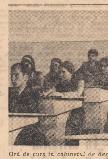
Oră de curs în cabinetul de desen tehnic al Liceului industrial nr. 2 energetic-Clujna