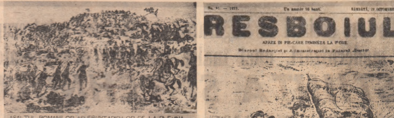
ASALTUL ROMANILOR ASUPRA TÂRIILOR DE LA PLEVNA

„Luarea redutei celei mari „Grivița” și păstrarea acesteia pînă azi este o seamă eroismului admirabil al bravilor oșteni români, care, dispunîndu-se în luptă, au reușit asupra formidabilului forț de repetate ori și, urcînd cu scările scurte inamicului, l-au respins din cubul aceluia înălțit. Victoria de la Grivița a făcut să luăm osteni strămoșesc jirmă în vechioi splendori. Toată presa europeană admiră astăzi eroica atitudine a trupelor române în singeroasa luptă de la Plevna. Bucuria ce trebuie să o simțim asupra succeselor strălucite ale stindardului român, care primul a fost plantat pe scările înalte de la Grivița, se turbură osteni numai prin știri ce ne scot de pierderi anormale ce le-au suferit bravele batalioane române. Ajutor pentru frații noștri! Săriți în ajutor bravilor de la Grivița care și-au vărsat sîngele pentru patrie! Aceste exclamări se aud osteni în toate părțile României, ele străbat pînă la noi. („Gazeta Transilvaniei”)