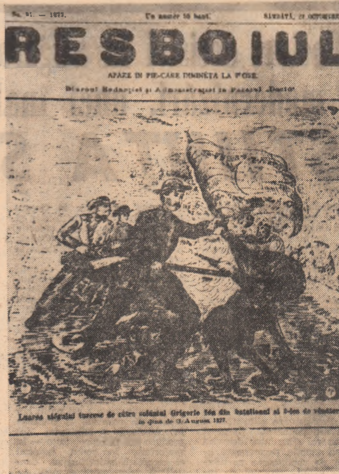
Luarea asaltului asupra țării de către batalionul al 2-lea de voluntari în ziua de 30 August 1877

„Luarea redutei celei mari „Grivița” și păstrarea acesteia pînă azi este o seamă eroismului admirabil al bravilor oșteni români, care, dispunîndu-se în luptă, au reușit asupra formidabilului forț de repetate ori și, urcînd cu scările scurte inamicului, l-au respins din cubul aceluia înălțit. Victoria de la Grivița a făcut să luăm osteni strămoșesc jirmă în vechioi splendori. Toată presa europeană admiră astăzi eroica atitudine a trupelor române în singeroasa luptă de la Plevna. Bucuria ce trebuie să o simțim asupra succeselor strălucite ale stindardului român, care primul a fost plantat pe scările înalte de la Grivița, se turbură osteni numai prin știri ce ne scot de pierderi anormale ce le-au suferit bravele batalioane române. Ajutor pentru frații noștri! Săriți în ajutor bravilor de la Grivița care și-au vărsat sîngele pentru patrie! Aceste exclamări se aud osteni în toate părțile României, ele străbat pînă la noi. („Gazeta Transilvaniei”)