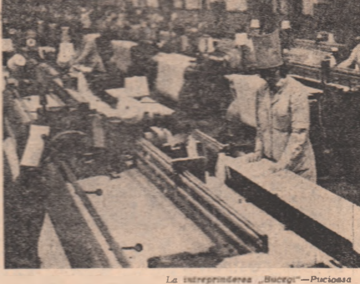
La întreprinderea „Bucegi” — Pucioasa

— Tot ceea ce legă de uti- lizarea metodelor cromatografice în studiul izomerizării