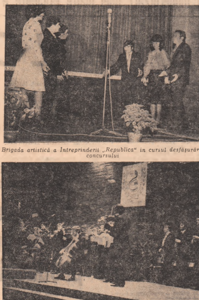
Brigada artistică a Întreprinderii „Republica“ în cursul desfășurării concursului