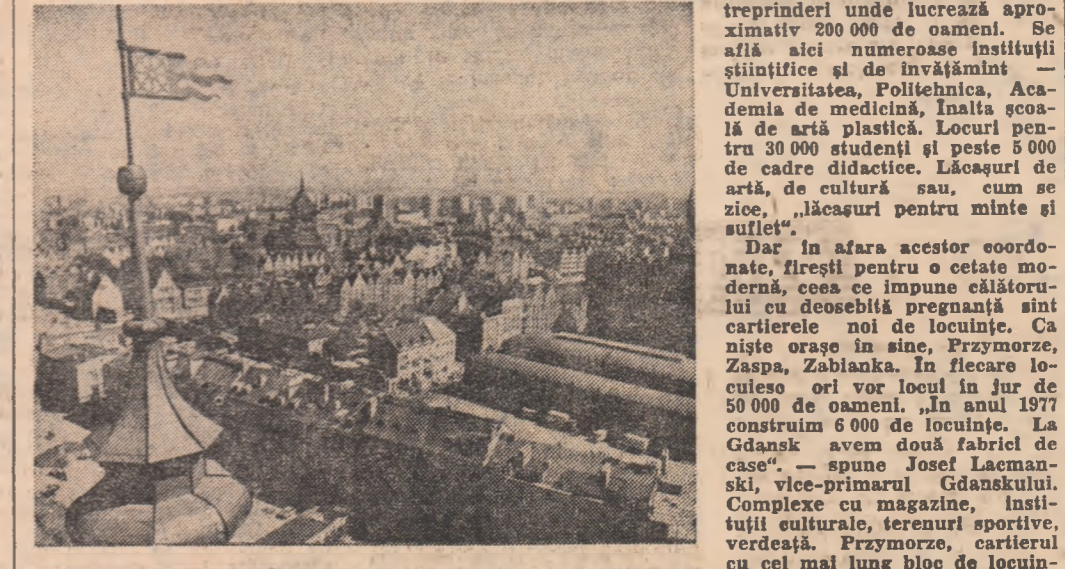
Insemnări din R.P. Polonă de N. D. Frunteleță

ca valerilor ordinului tenon, și-a adăugat mereu noi peceți la însemnele existenței sale. S-a împins mereu prin vocația zidirii, prin monumentele sale pieritoare, adunate azi în orașul Vechi — Stare Miasto care păstrează, în arhitectura și așezarea din secolele XVI—XVIII, catedrala Felxari Maria, una dintre cele mai mari ale țării, Arsenalul, porțile orașului. Ea are vechi, cu armelele gotice și ale epocii mai târzii, a fost restaurat, ca și casa, în linia unui oraș modern. Pentru desăvîșirea acestui veritabil act de cultură — o operă unică în lu-