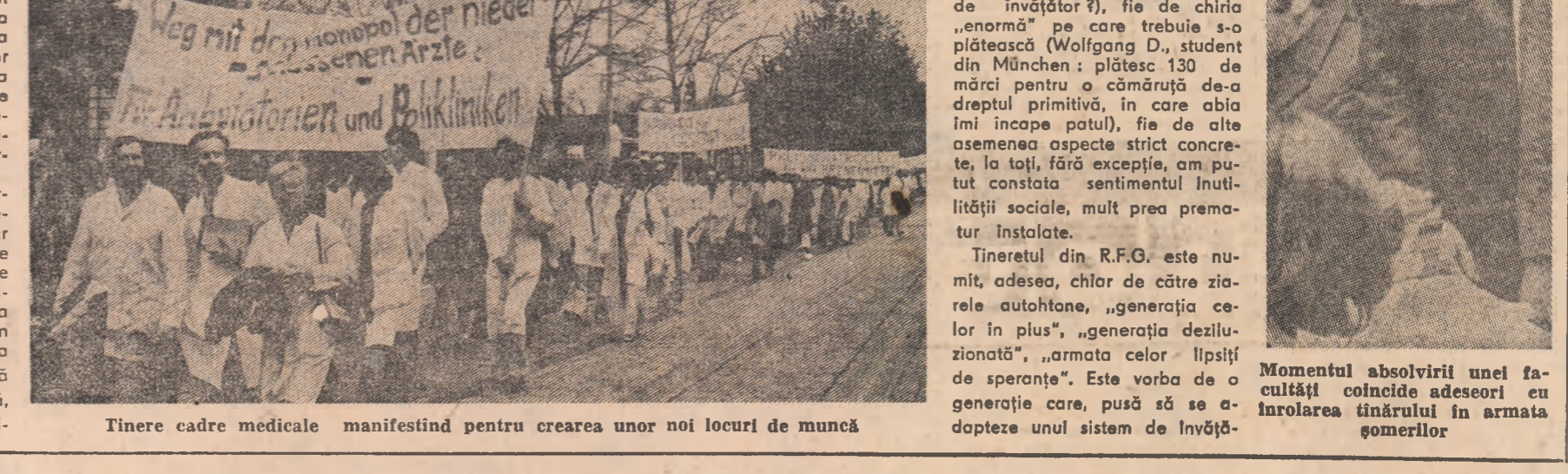
Tinere cadre medicale manifestînd pentru crearea unor noi locuri de muncă