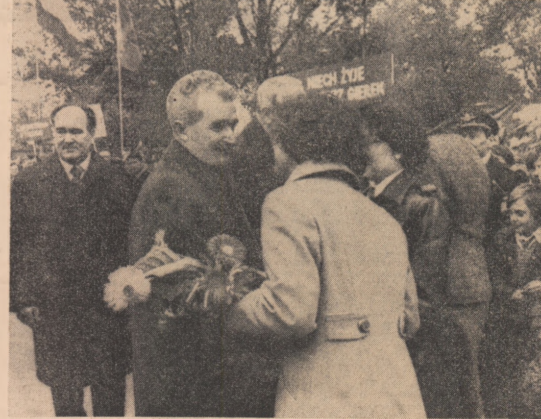
Locuitorii Varșoviei au întâmpinat cu deosebită căldură pe solii poporului român