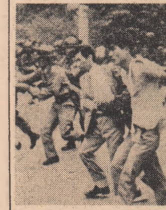
Forțele polițienești ale regimului de la Seul reprimă cu brutalitate o manifestație a studenților

Manifestul exprimă „sprijinul total față de Carta democratică și a salvariilor naționale” pe care personalități democratice din Coreea de sud au publicat-o în marele cerind interzicerea de a marie cerind interzicerea aboliției „Constituției de renovare” și a măsurilor de urgență. Tinerii din localitatea Kwangjoud din provincia Djeulla de sud au demonstrat în fața comisariatului de poliție cerind eliberarea colegilor lor deținuți ilegal. În revendicarea lor, tinerii cereau abolirea legilor în vigoare cărora se încălcă drepturile fundamentale ale omului, libertatea cuvântului și libertatea de întruniri, precum și eliberarea tuturor deținuților. Toate aceste acțiuni protestatarie ale tinerilor sud-coreeni au fost urmate de represiuni brutale. Aparatul de opresiune de la Seul face uz de un întreg arsenal de mijloace și metode de intimidare, persecuție, mergând până la desființarea fizică a celor care se opun regimului antidemocratic și antipopular. Zece de studenți au fost arestați fără mandat, răpiți, amenințați, su-