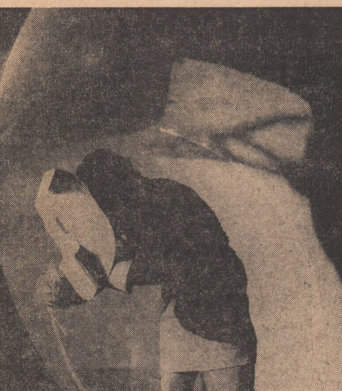
Întreprinderea de utilaj chimic Gătești

De subliniat că îndeplinirea ritmică și depășirea sarcinilor de plan și a angajamentelor asumate în întrecerea socialistă s-au înfăptuit în condițiile creșterii calității și competitivității produselor, ceea ce se explică și prin faptul că 9 mari unități economice hunedorene au îndeplinit până la această dată planul de livrare a export pe perioada ianuarie-mai.