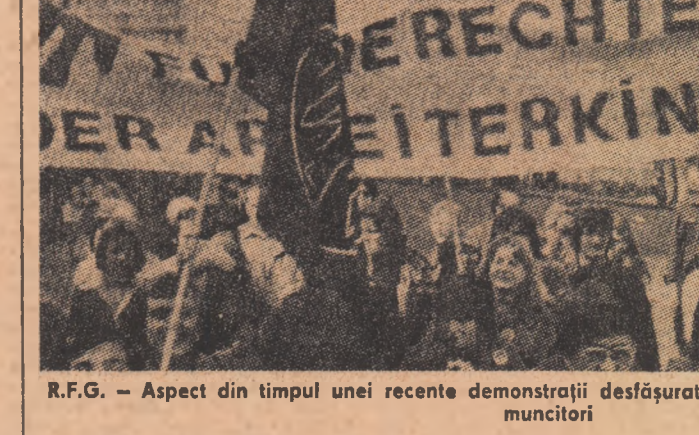
R.F.G. — Aspect din timpul unei recente demonstrații desfășurate în sprijinul drepturilor copiilor de muncitori

„Creația profundă care traversează învățământul este indisolubil legată de criza economică, socială și culturală ce zguduie țările occidentale dezvoltate; tendința tot mai generalizată în țările occidentale de a reduce investițiile în sectorul educației pune în pericol altul cel mai important sistem al societății — creșterea sistemului de învățământ, în special în ceea ce privește învățământul profesional, universitar și științific. În prezent școlarii din țările dezvoltate sunt în număr de 150 milioane, față de 49 de milioane în țările în curs de dezvoltare.”