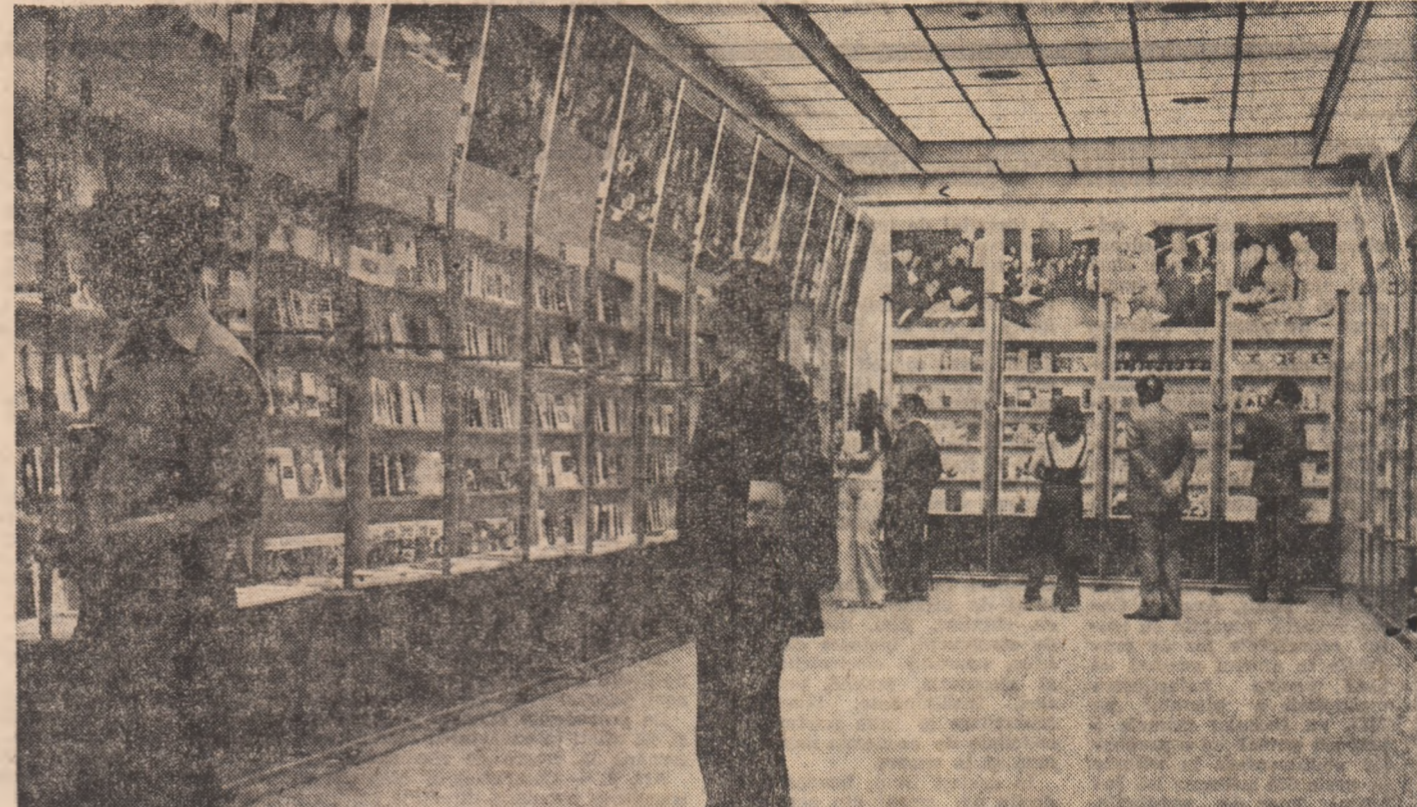
Fotografiile paginii VALERIU TANASOFF