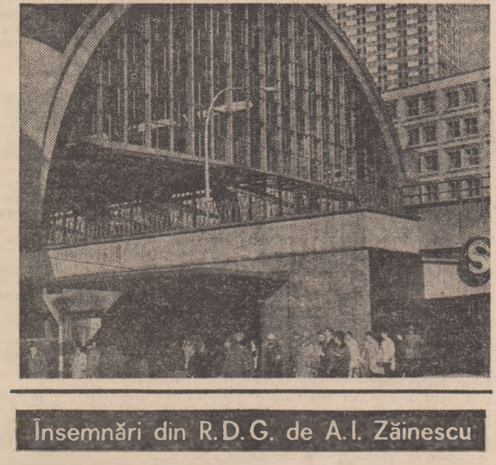
Insemnări din R.D.G. de A.I. Zăinescu