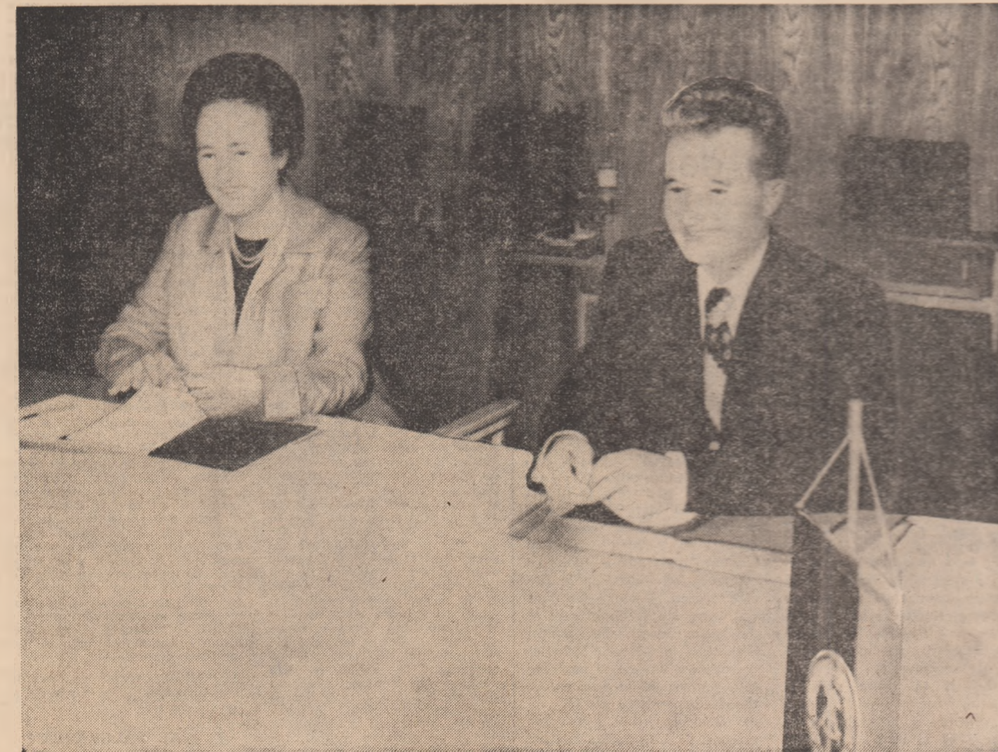
La convorbiri au participat: din partea română — tovarășii Elena Ceaușescu, membru al Comitetului Politic Executiv al C.C. al P.C.R., tovarășii Manea Mănescu, membru al Comitetului Politic Executiv al C.C. al P.C.R., prim-ministru al guver-