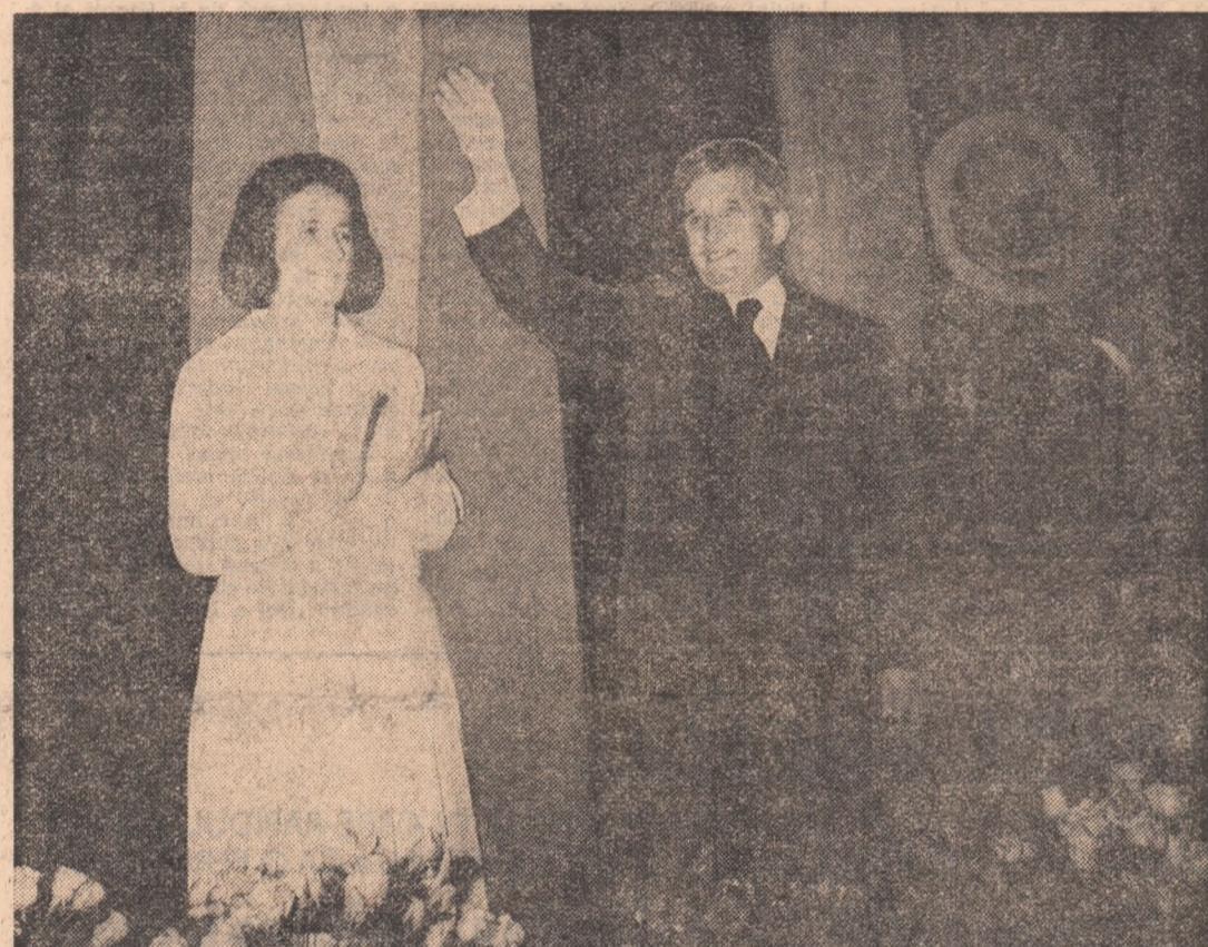
(Continuare în pag. a III-a)