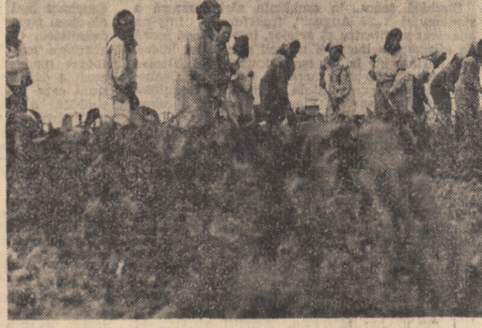
Intreprinderea culturii de porumb, o acțiune la care nu participă încă tot satul, așa cum o solicită cîmpul. Rezolvarea „problemelor” ne-o oferă, așa cum am surprins în reportajul nostru, toți cooperatorii.