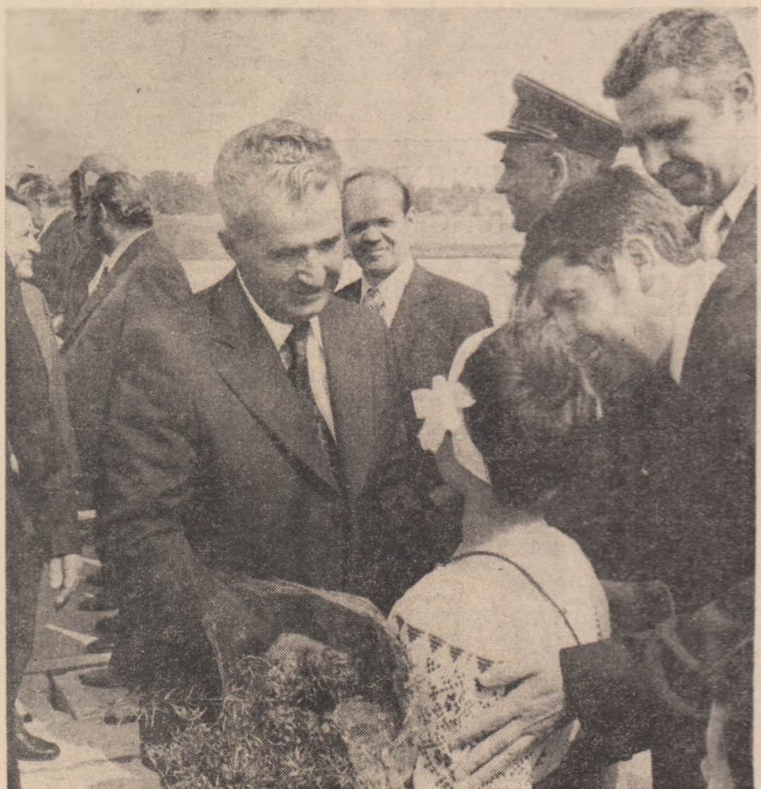
Călduros bun sosit la Debrețin