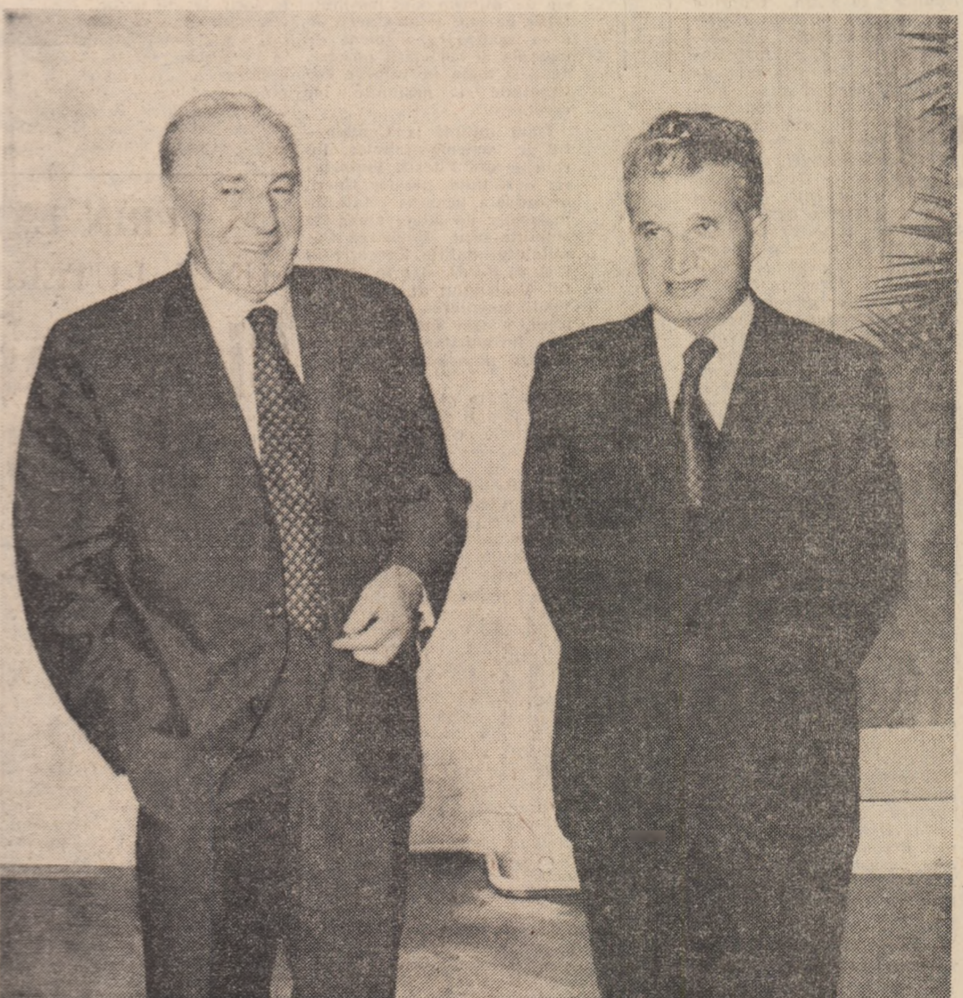
Moment din timpul întîlnirii