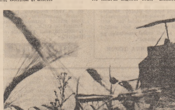
Pregătite din timp, în unele locuri, acolo unde orzul s-a cîpt, combinele au intrat în lan

Recoltatul furajelor se desfășoară în bune condiții de trifolienne, unde jumătate din suprafață este strînă. În schimb, fițele naturale sint coșite doar pe 14 la sută din suprafață.