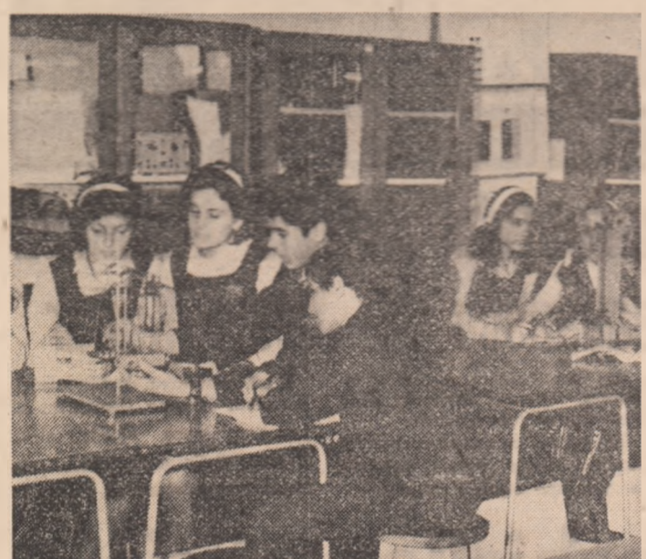
In timpul orelor de laborator — fizică