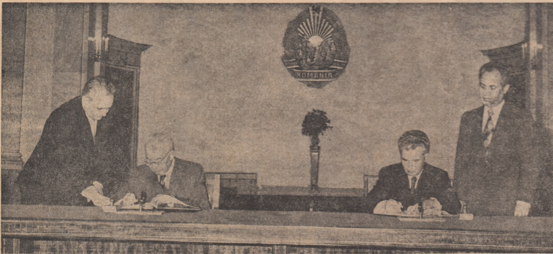
Tovarășii Nicolae Ceaușescu, secretar general al Partidului Comunist Român, și Gustav Husak, secretar general al Partidului Comunist din Cehoslovacia...

Mii de bucureșteni au întâmpinat cu căldură, cu sentimente de înaltă stimă, pe cei doi conducători de partid și de stat