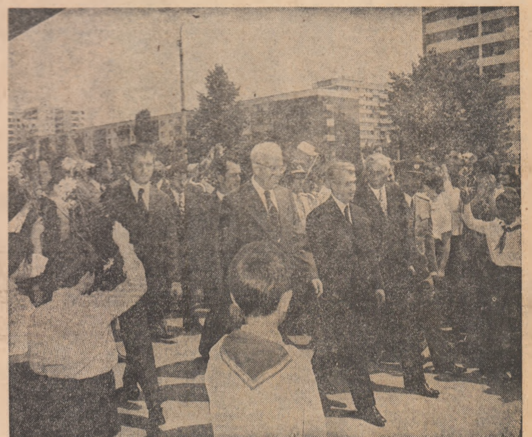
După încheierea celei de-a doua runde de convorbiri la nivel înalt român-cehoslovac, tovarășii Nicolae Ceaușescu și Gustav Husak au făcut, vineri la amiază, o vizită în Capitală...

Încheierea convorbirilor oficiale PLECAREA DIN CAPITALĂ A TOVARĂȘULUI GUSTAV HUSAK