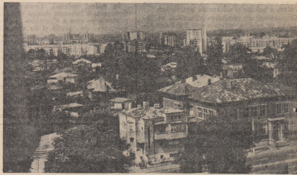
Din noul peisaj al Tîrgoviștei