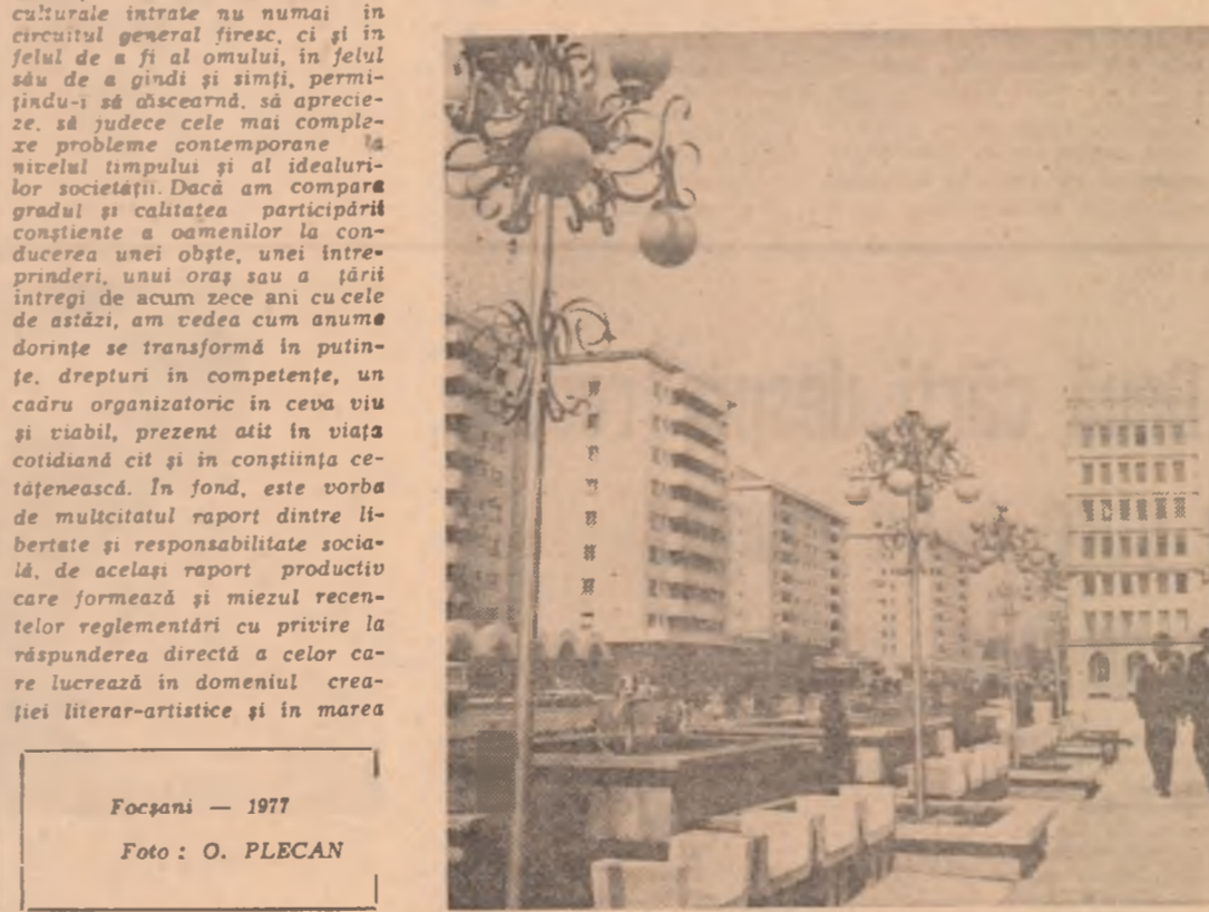
Focșani — 1977.