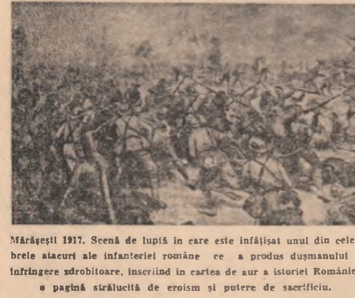
Mărășești 1917. Scenă de luptă în care este înfățișat unul din celebrele atacuri ale infanteriei române ce a produs dușmanului o înfrângere zdrobitoare, înscrisă în cartea de aur a istoriei României o pagină strălucită de eroism și putere de sacrificiu.

1914. Proletariatul, mișcarea socialistă au dezavut războiul imperialist, au organizat largi acțiuni de masă pentru înfrângerea acestuia.