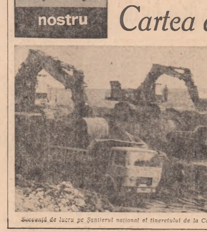
Scurșuri de lucru pe Șantierul național al tineretului de la Canalul Dunărea-Marea Neagră.