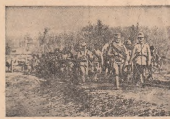
Eliberarea Transilvaniei de sub ocupația străină este un fapt implitit. Trupele noastre victorioase pășeau pe pământul acestei străvechi vetre a poporului român.