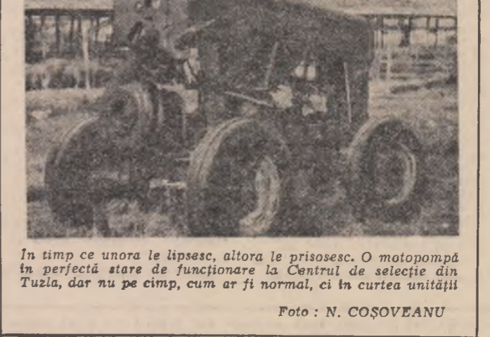
În timp ce unora le lipsesc, altora le prisosesc. O motopompă în perfectă stare de funcționare la Centrul de selecție din Tulza, dar nu pe cimp, cum ar fi normal, ci în curtea unității (Așerpres)