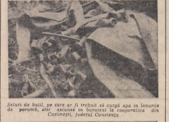
Seturi de butii, pe care ar fi trebuit să curgă apa în lanurile de porumb, sînt ascunse în buruienii la cooperativa din Costinești, județul Constanța