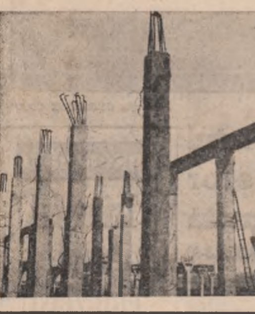
Casa cu 200 de fete