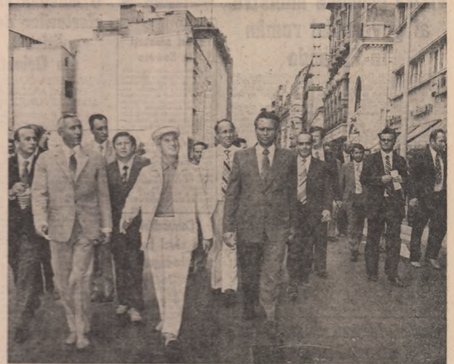
secretarul general al partidului a tras atenția în următorii doi ani să se încheie construcția tuturor ansamblurilor arhitectonice prevăzute a fi ridicate în tranșeele centrale ale Capitalei.